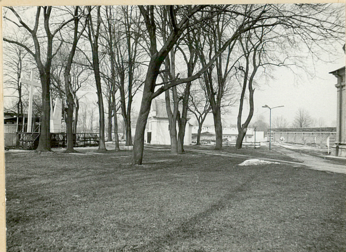
5. WIDOK W KIERUNKU PN