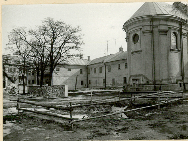
7. WIDOK OD KADLICY W KIERUNKU WSCH.