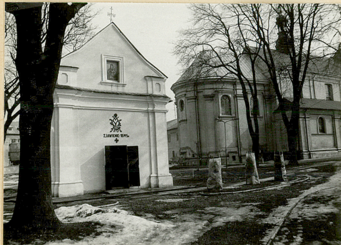
6. KAPLICA OBJAWIENIA NMP