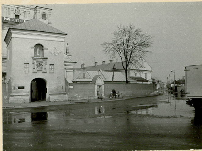
2. WIDOK W KIERUNKU PD-ZACH.