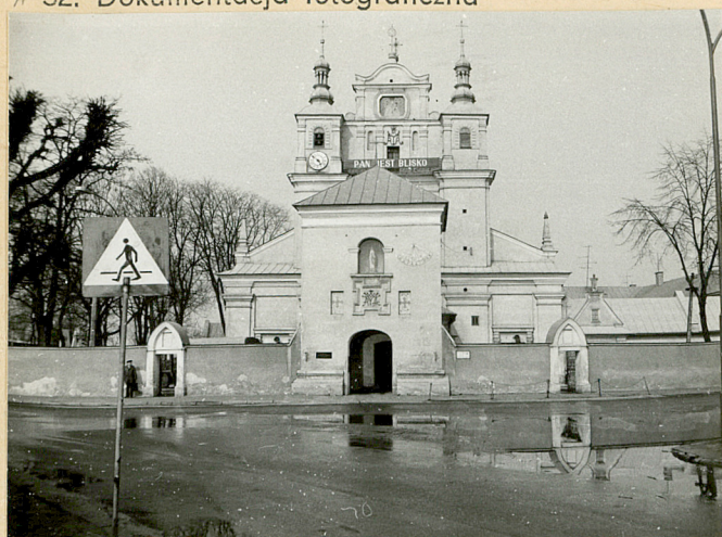
1. WIDOK OD POŁUDNIA