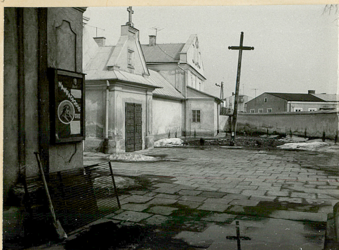
3. WIDOK W KIERUNKU PN-WSCH.