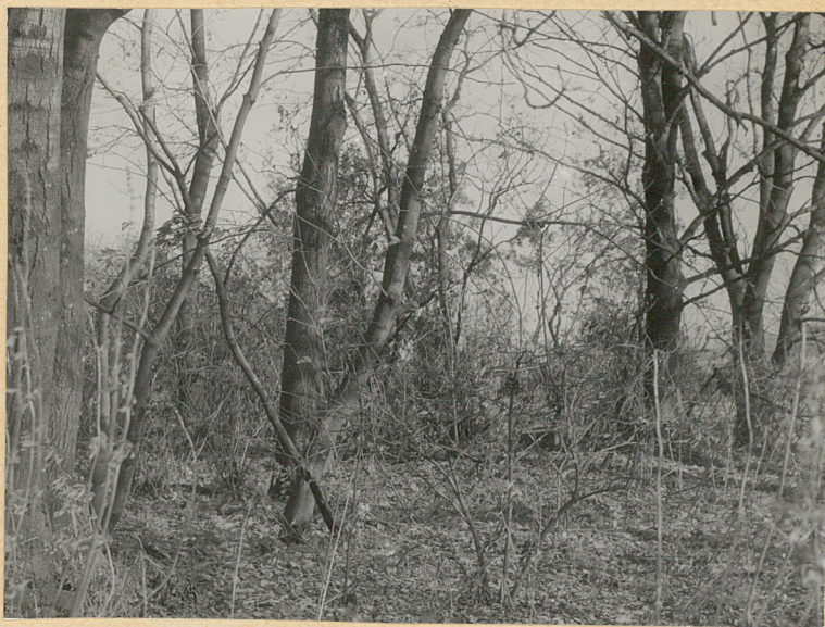
4. Wnętrze cmentarza, część północna