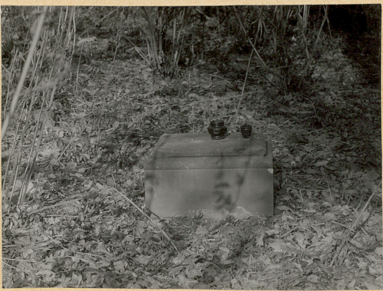
6. Pozostałości nagrobka we wschodniej części cmentarza.