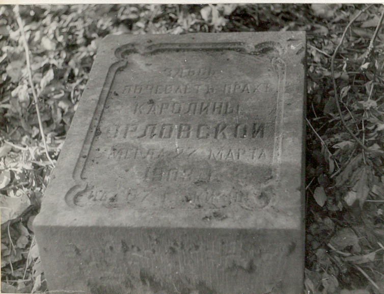
9. Płyta nagrobna "Karoliny Orłowskiej zmarłej 27 marca 1903 roku w 87 roku życia."