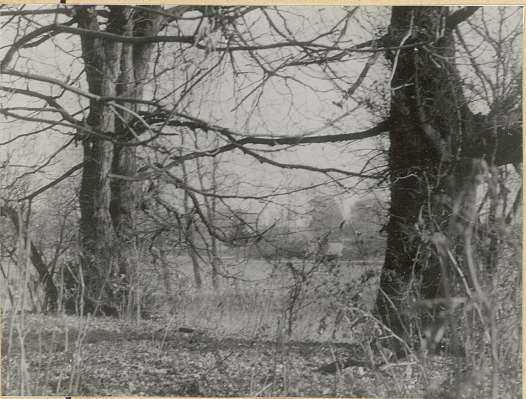
5. Stare lipy w południowej części cmentarza.