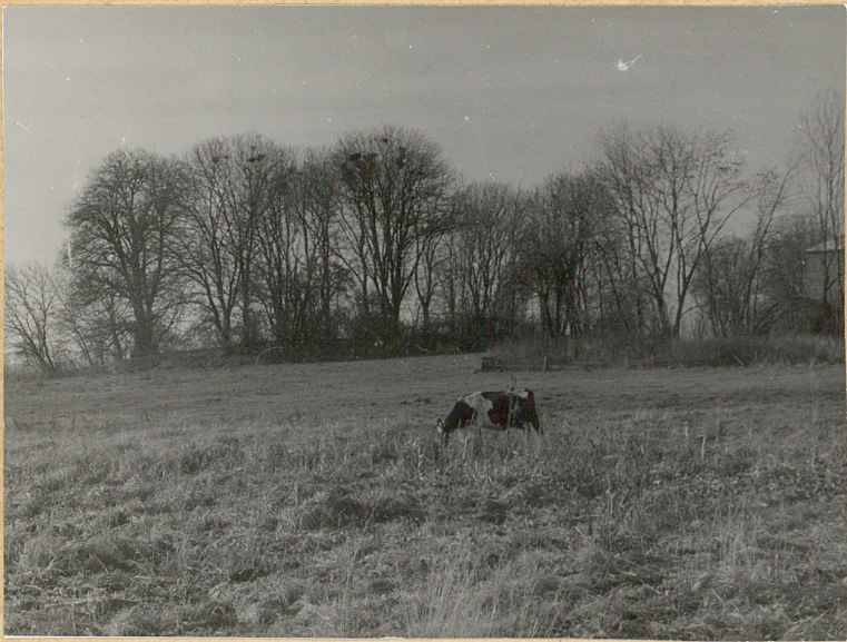
1. Widok cmentarza od strony wschodniej