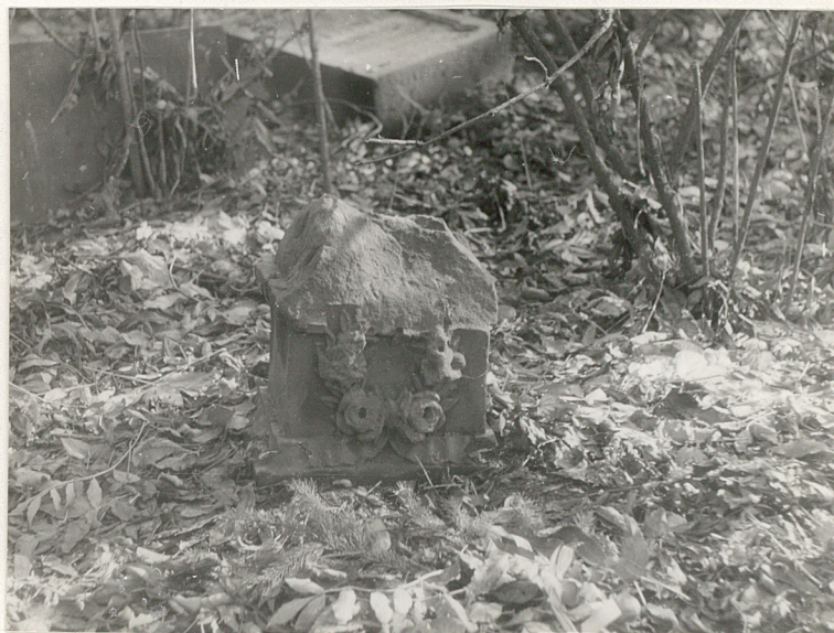
8. Fragment zwieńczenia nagrobka