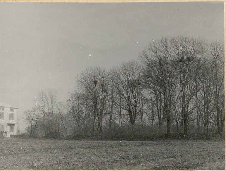
3. Widok cmentarza od strony zachodniej