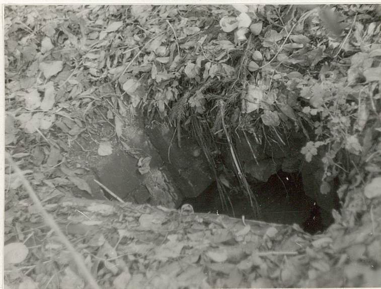
10. Otwarta krypta grobowa z widocznymi dwiema metalowymi trumnami, z których jedna otwarta.