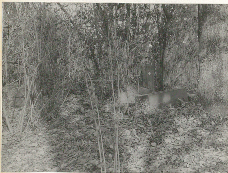
7. Fragment nagrobka i słup ogrodzenia