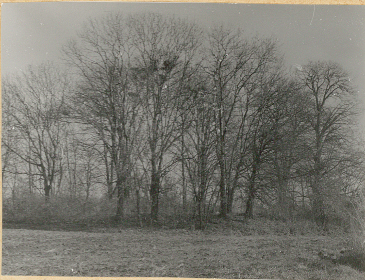
2. Widok cmentarza od strony południowej