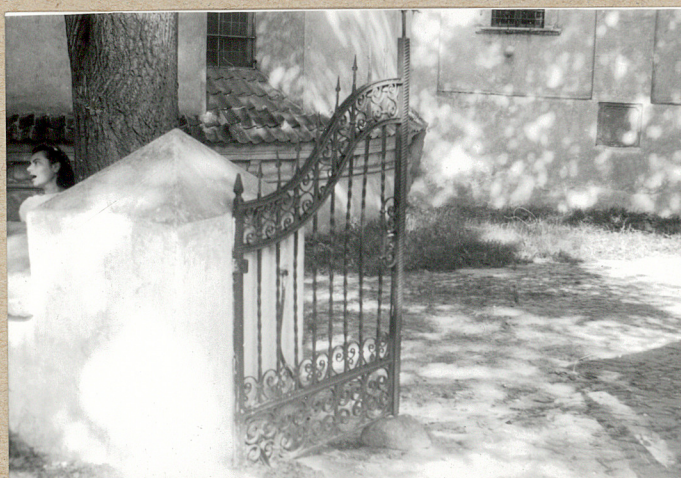
brama - od strony wsch.