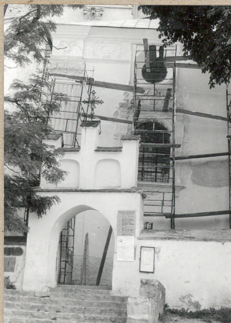
główna brama - od zewnątrz