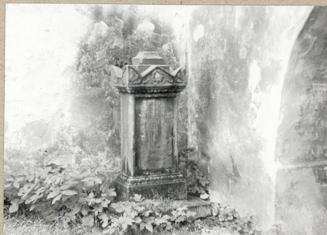
mościłek na cmentarzu