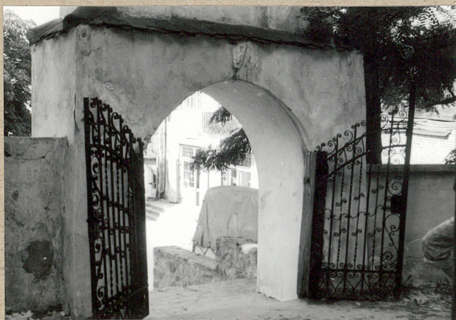
główna brama - od strony cmentarza