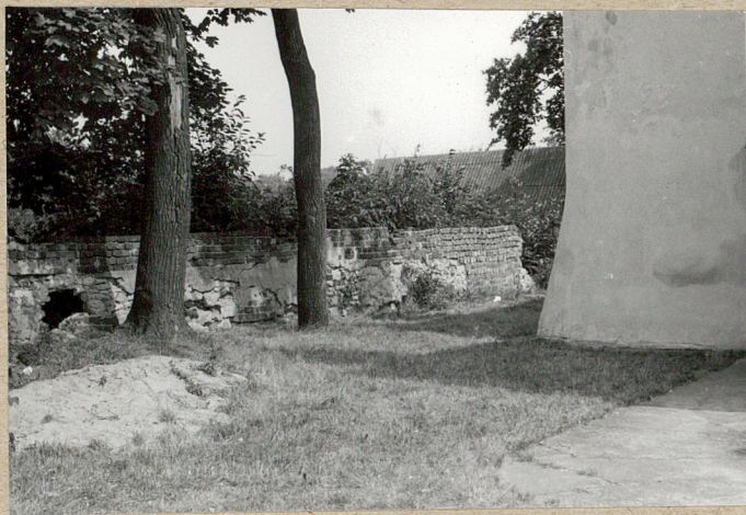
fragment ogrodzenia od strony pn.