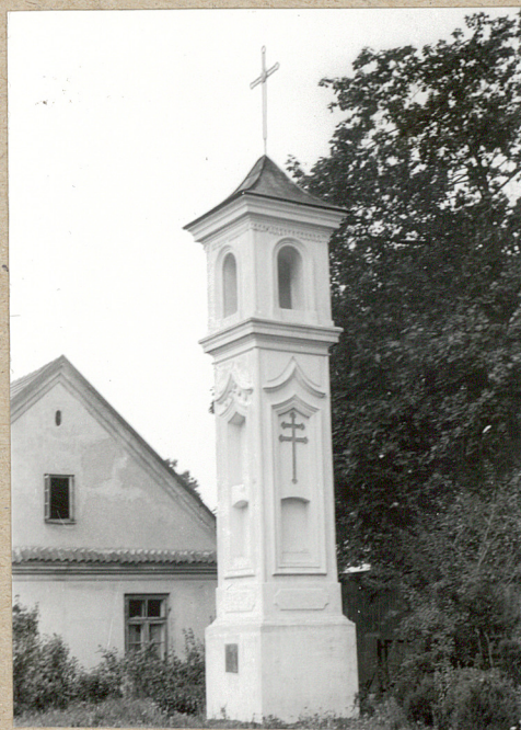
kapliczka na cmentarzu przed kościołem