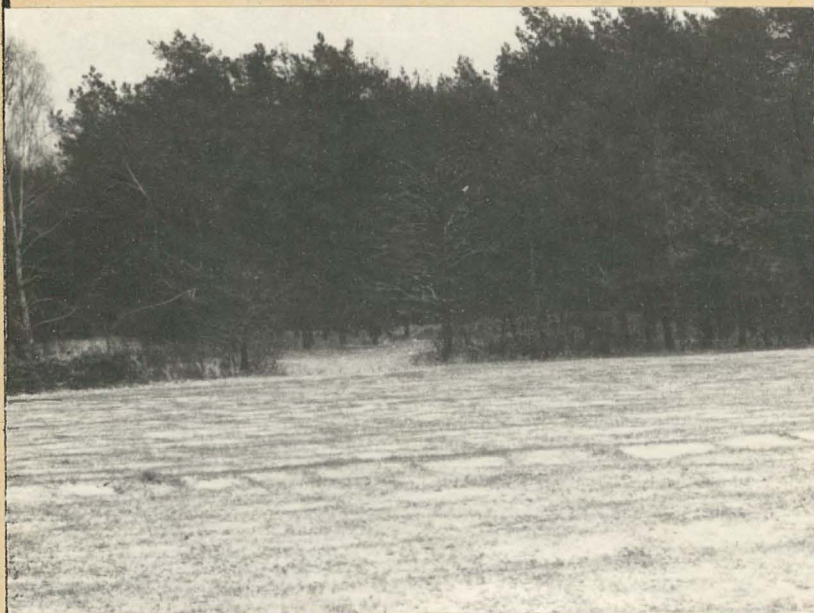
Fot. 3. Widok od strony rzeki.