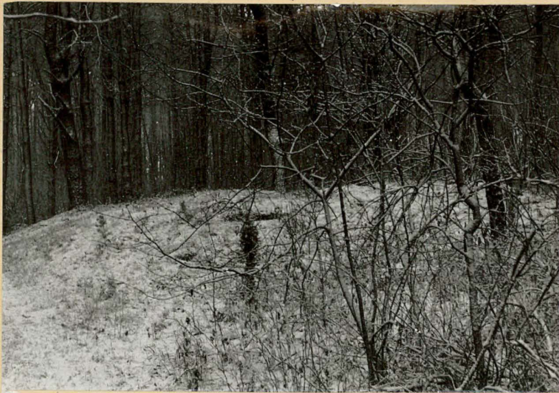
Fot.1 Widok na kurhan od strony południowo-zachodniej