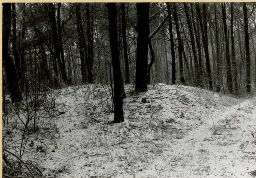
Fot.2 Widok na kurhan od strony północno-wschodniej