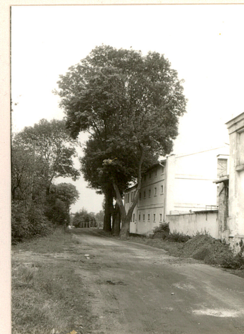
fot.2 Dojazd od ul. Malwowej