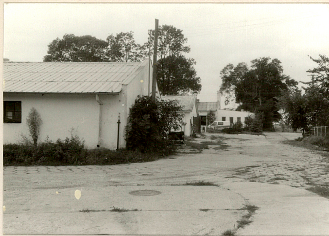
fot.4 Część gospodarcza, widok w str. gł. wjazdu