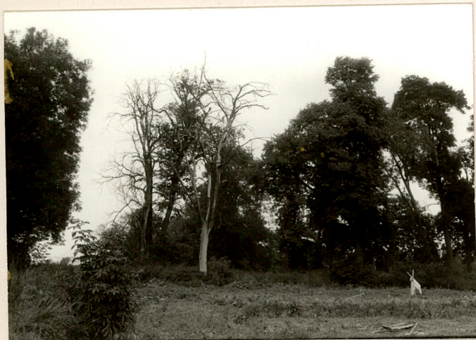
fot.13 Fragm. parku na pn. od d. dworu