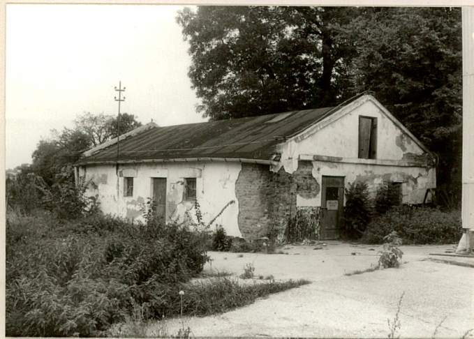
fot.7 Oficyna /kuchnia/ przy d. dworze