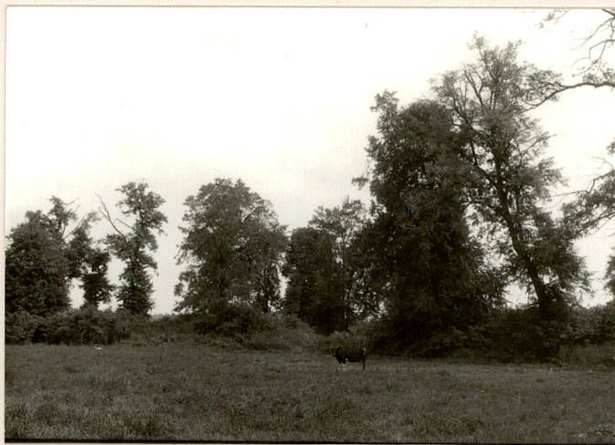
fot.14 Widok na cz. wsch. parku