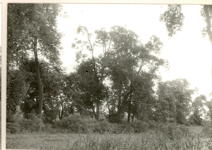
fot.12. Fragm. wnętrza parku w cz. pn.

Wkładkę założył: W.Boruch, IX.96 (imię, nazwisko, data)