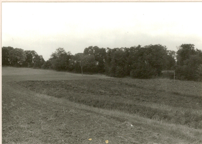
fot.8 Widok ogólny zespołu od str. pd.