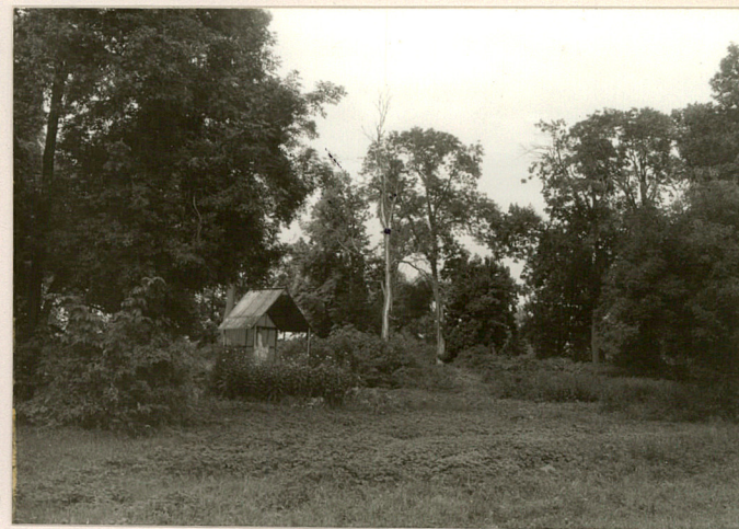
fot.15 Część środkowa parku, widoczna kapliczka z figurą MB