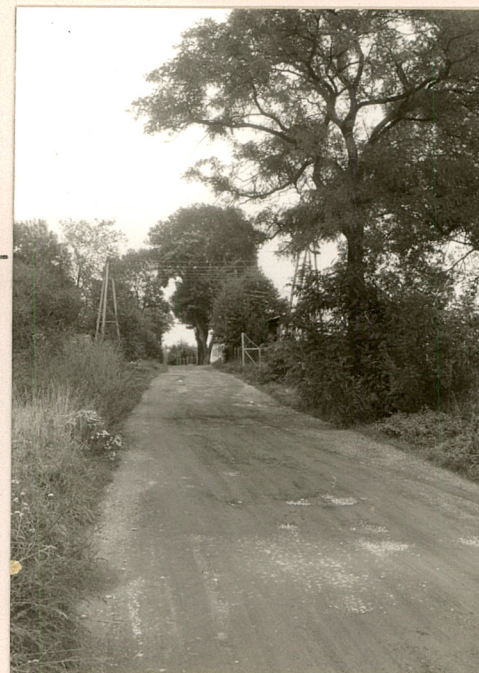
fot.1 Dojazd od str. ul. Malwowej

Wykaz obiektów dla których założono karty szczególne: rządówka, śpichlerz, chlewnia