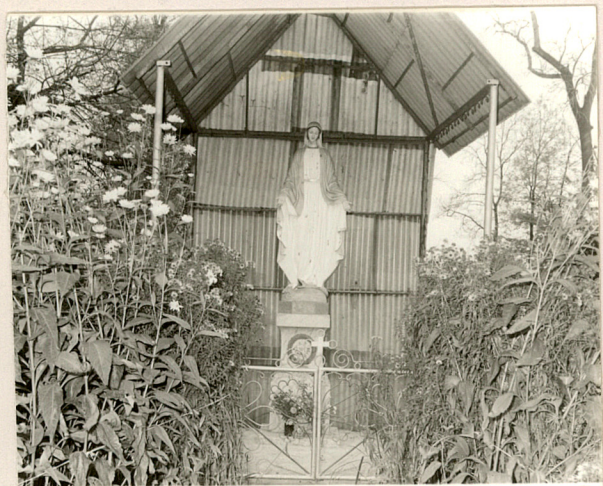
FOT. 16 KAPLICZKA W PARKU Z FIGURĄ, M.B.