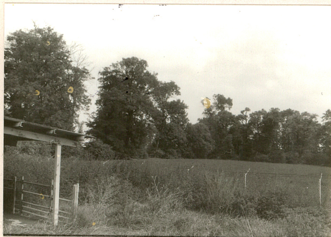
fot.10 Widok ogólny na park od str. zach.