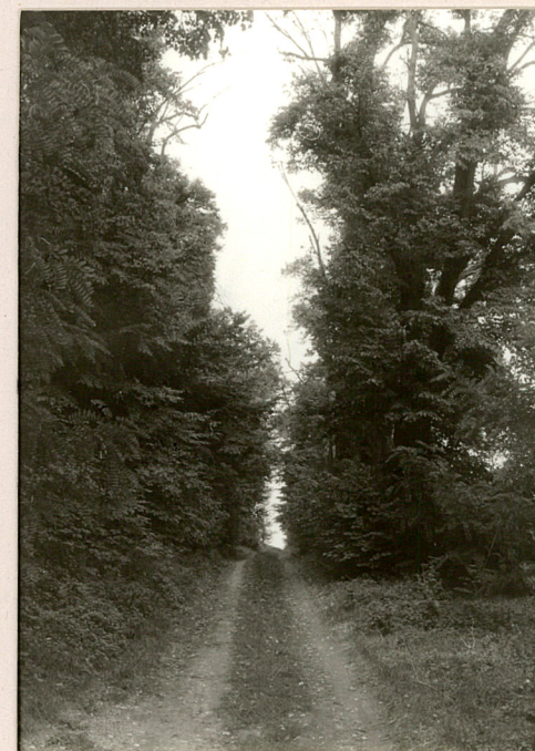
fot.9 Lipowa aleja dojazdowa do dworu