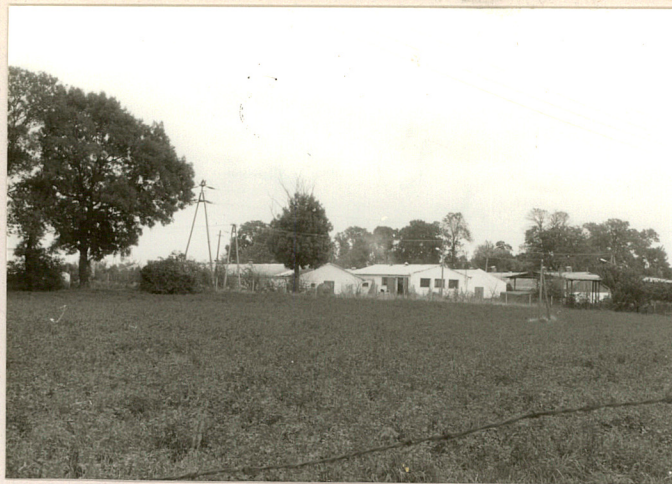
fot.5 Widok ogólny cz. gospodarczej od str. pd.-zach.