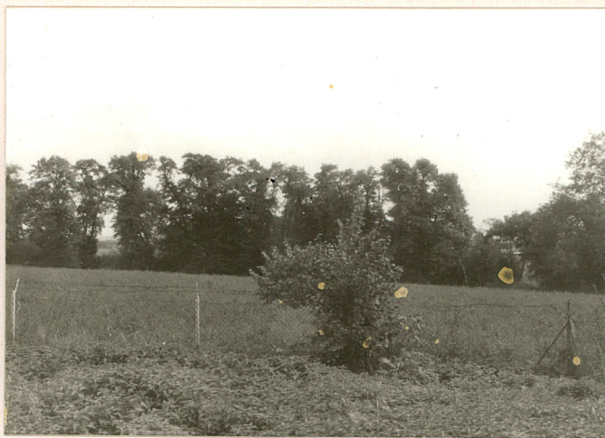
fot.11 Widok ogólny na park od str zach.