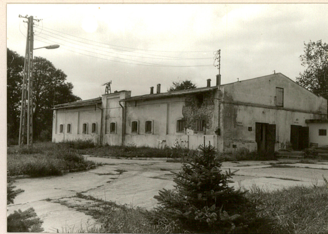
fot.6 Obora w cz. zach.