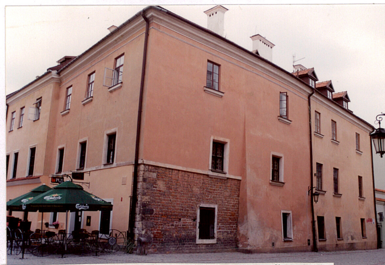
Wschodnia elewacja kamienicy 6B wraz z oficyną.