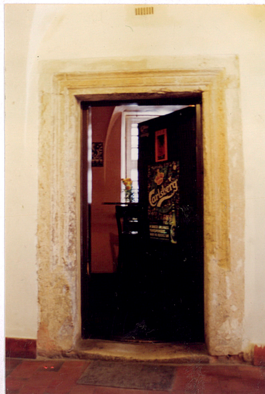
Portal w sieni 6B.