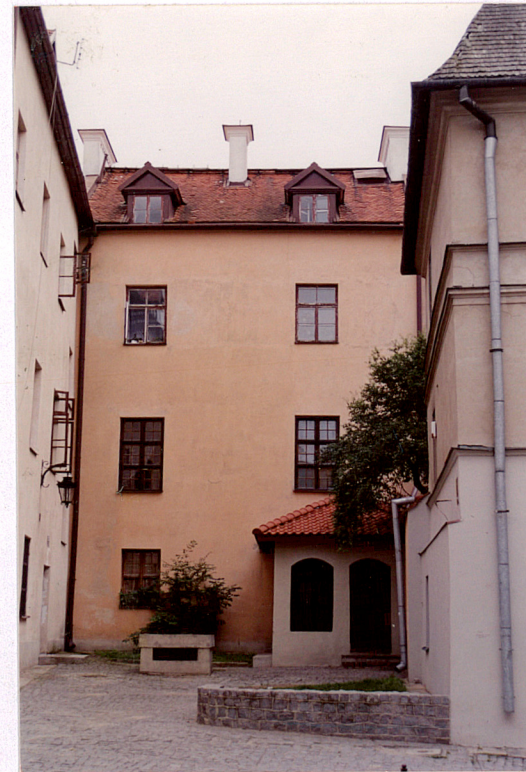
Elewacja północna kamienicy Złota 6A.