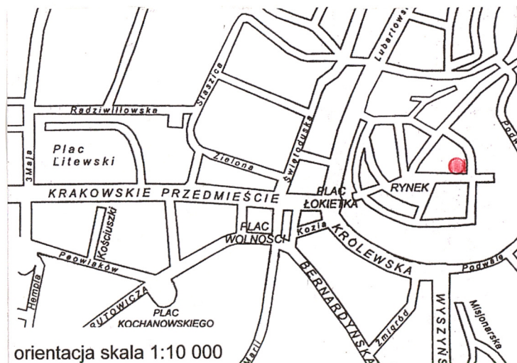
orientacja skala 1:10 000