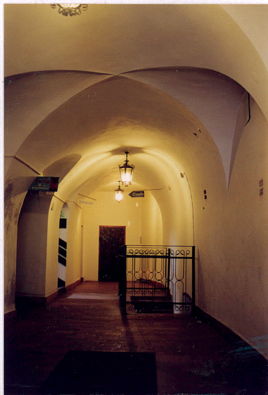
Wnętrze sklepionej sieni 6B.

Instalacje: wod.-kan., elektryczna, gazowa, c.o., telefoniczna.