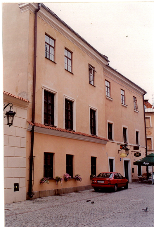
Elewacja frontowa od strony ul. Złotej.

11. Zdjęcia, rzut, przekrój, sytuacja, orientacja