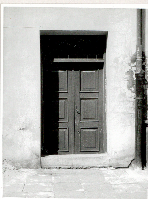
drzwi w elewacji tylnej