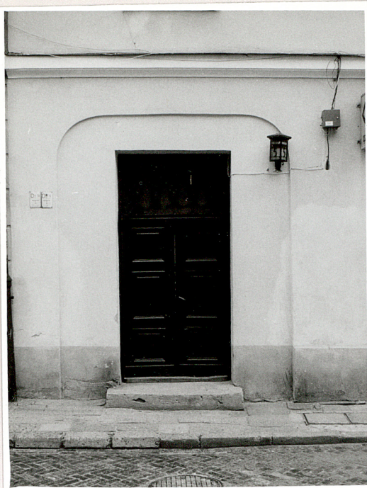
drzwi w elewacji front.