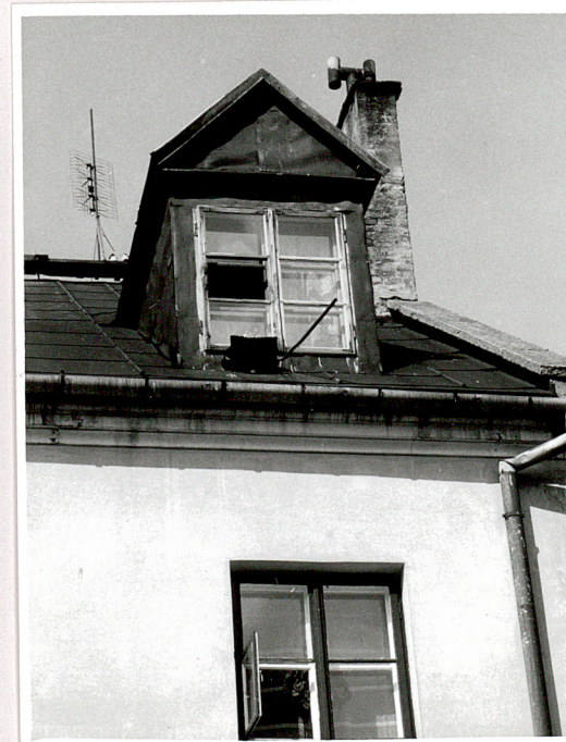
mansardowe okno elewacji tylnej