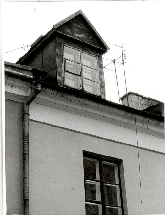
mansardowe okno elewacji front.