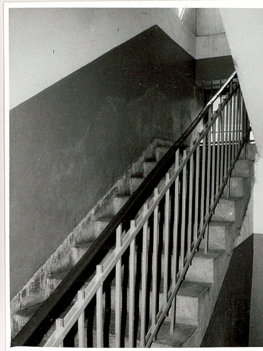
wystrój klatki schodowej