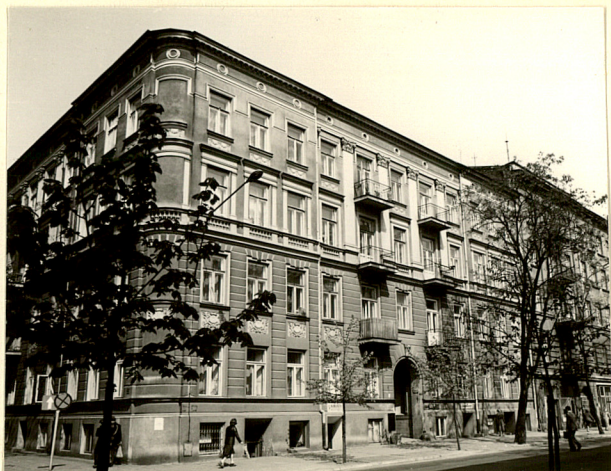
Wkładka 1. Kamienica, Lublin, ul. Chopina 3.