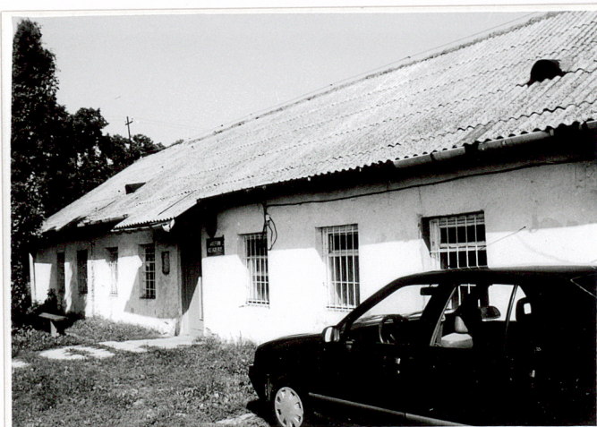
2. Zach. część elewacji frontowej /pd./