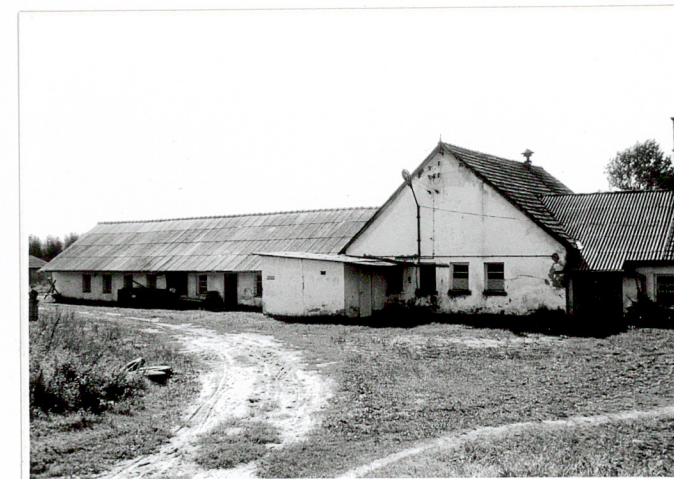
4. Wsch. część elewacji tylnej /pn./

Wkładkę założył: ANNA SIKORA-TERLECKA 9.11.1999 r. .... (imię, nazwisko, data)