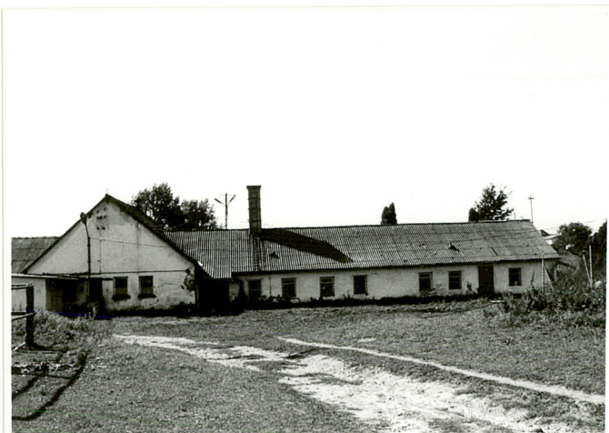
5. Zach. część elewacji tylnej /pn./