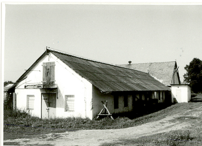
6. Elewacja boczna /wsch./