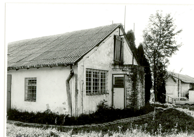
7. Elewacja boczna /zach./