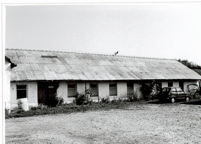
3. Wsch. część elewacji frontowej /pd./