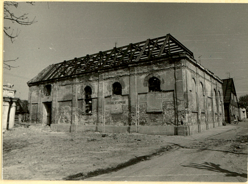
Elewacja południowa i wschodnia.