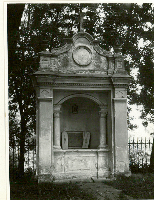
Kapliczka w ogrodzeniu.