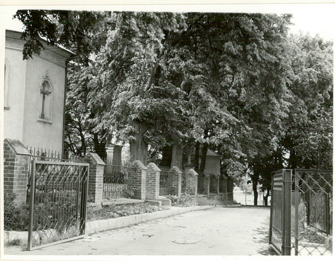
Ogrodzenie od wschodu.