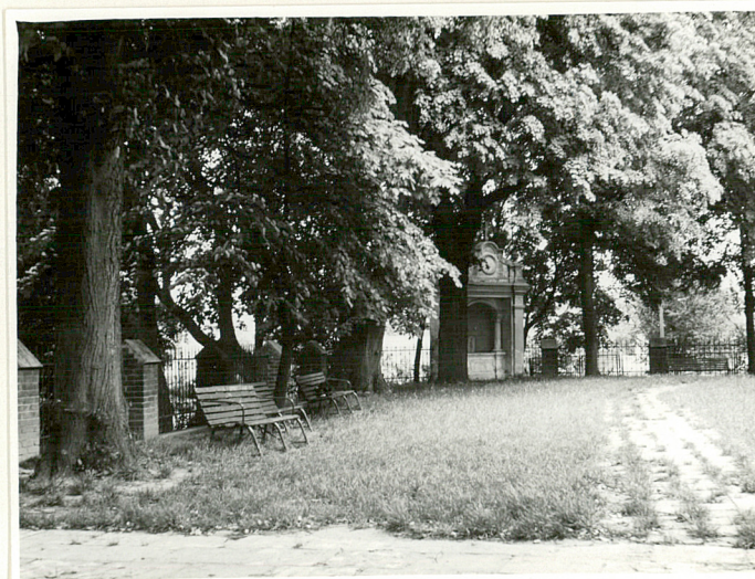
Ogrodzenie od północy.