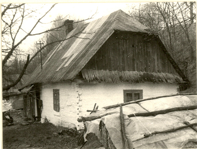
Fot.1 Widok od pd.-wsch.

Wkładkę założył: Bożena Lebioda, X.1990 r. (imię, nazwisko, data)