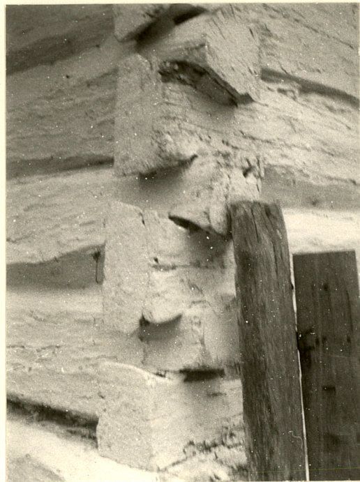
Fot.3 Zwęglowanie ścian od pd.-zach.