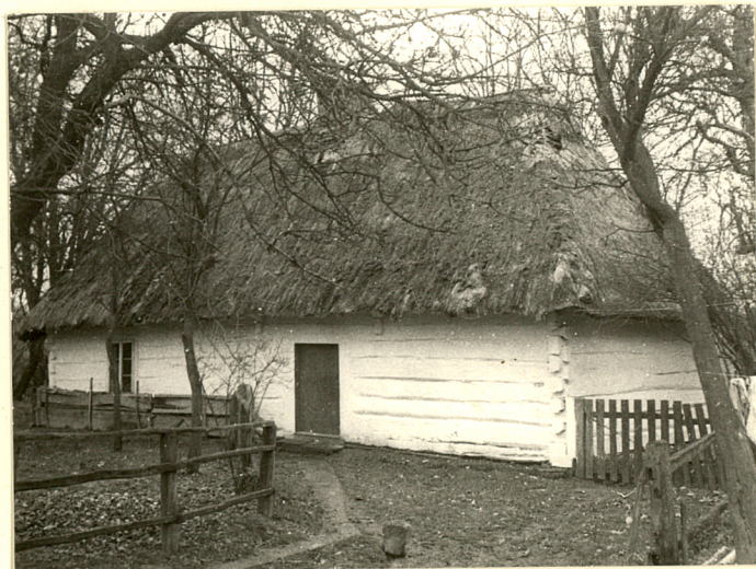
Fot.1 Widok od pn.-zach.