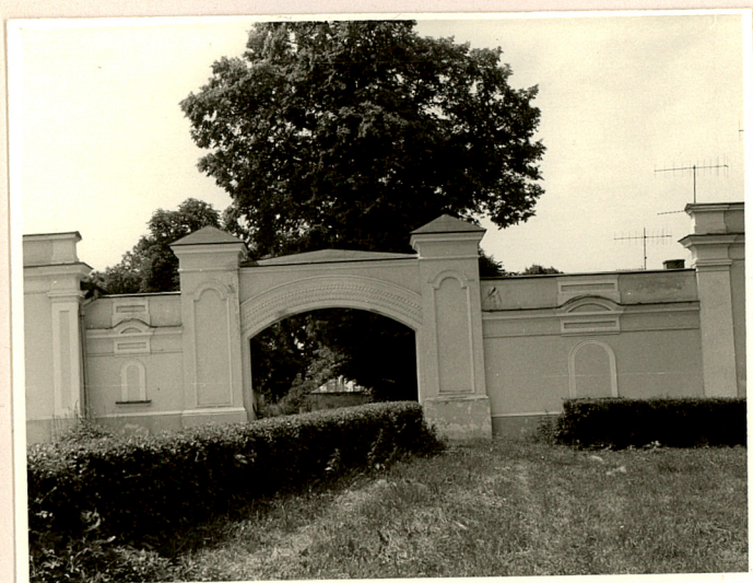
Fot. 1 Elewacja frontowa.