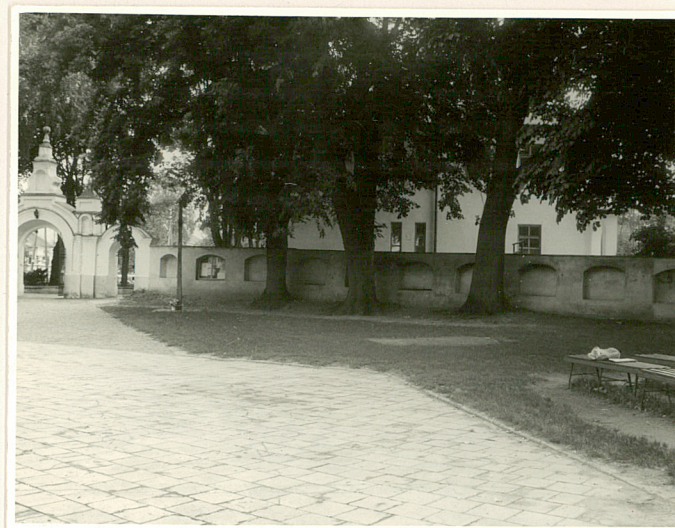
fragm. ogrodzenia od płn.