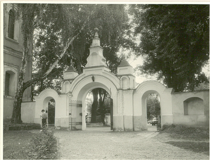
brama główna od płn.