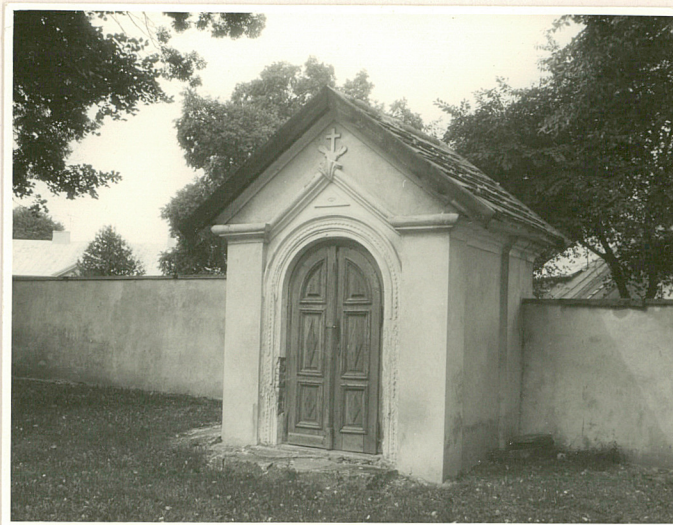
kapliczka w w ogrodzeniu