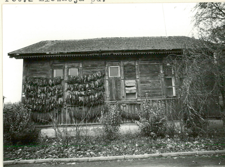
Fot.2 Elewacja pd.