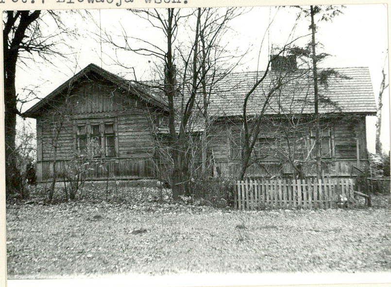
Fot.1 Elewacja wsch.