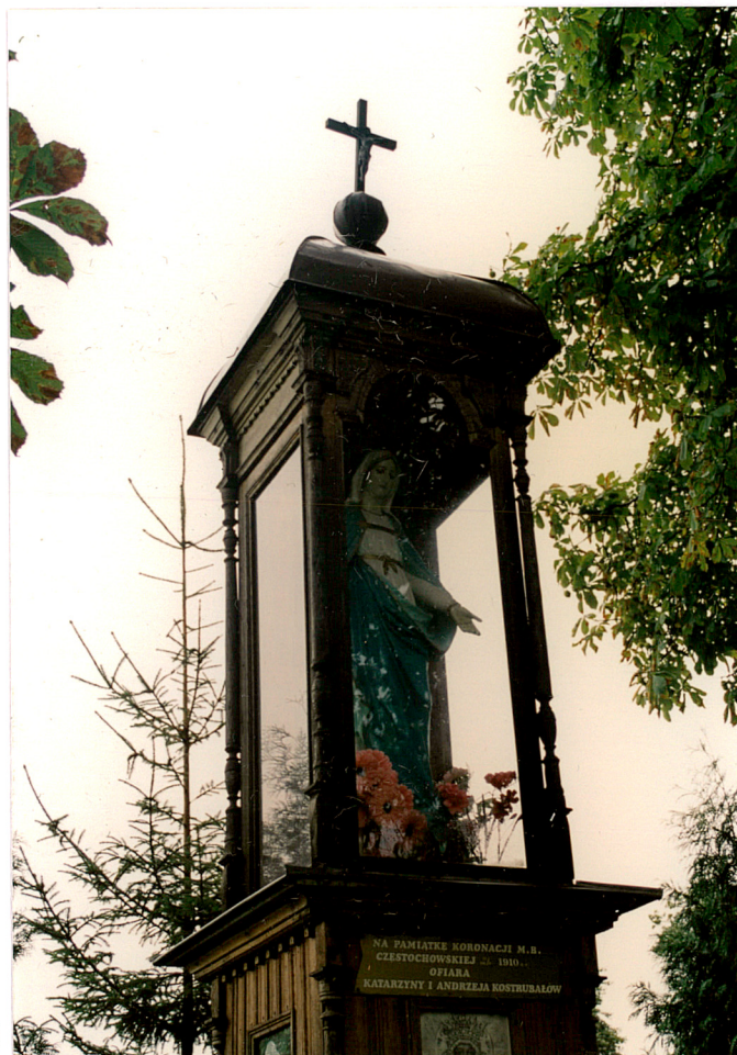
Fot. 2. Widok ścianki bocznej od południa