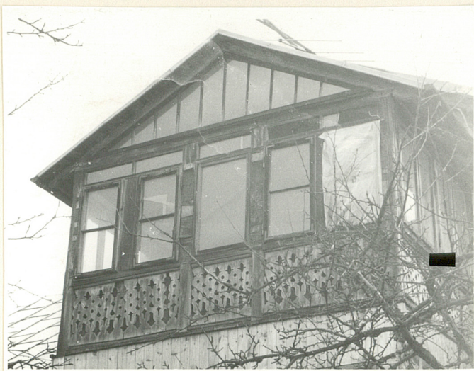
Balkon od frontu.