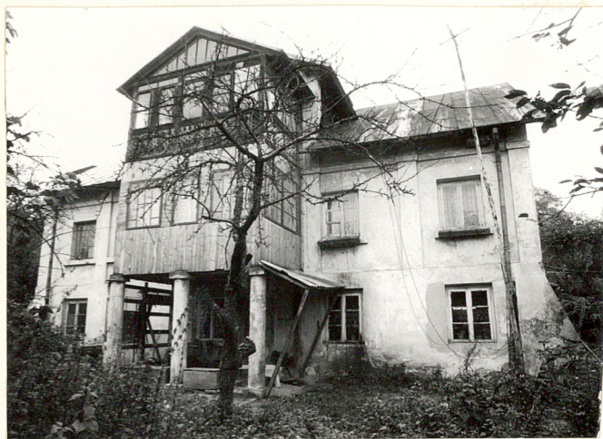
Widok od frontu.

11. Zdjęcia, rzut, przekrój, sytuacja, orientacja