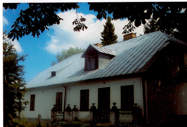
1- 3. Fragmenty fasady. 4. Elewacja tylna.