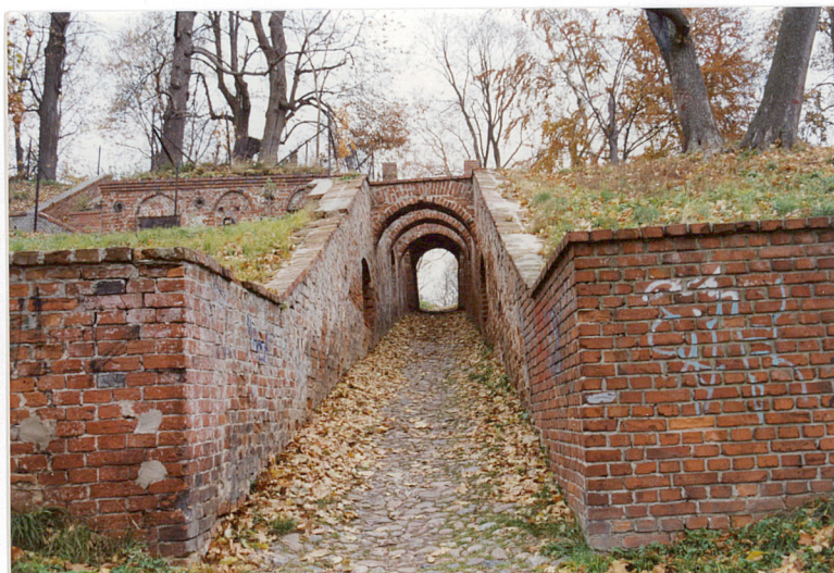
Fot.1 Widok od zach.