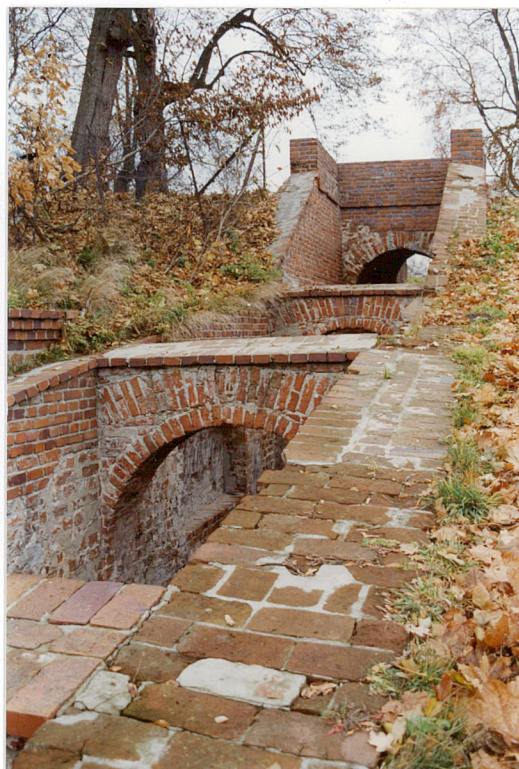
Fot.2 Widok z góry od pd.-zach.