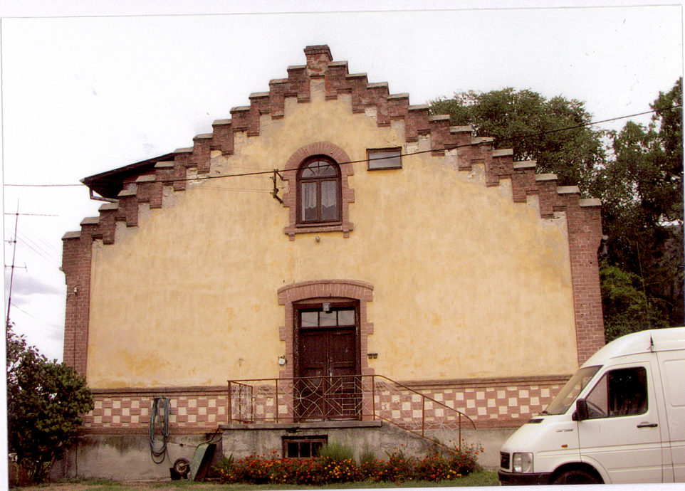
4. Piotrawin, stara plebania, elewacja pld.