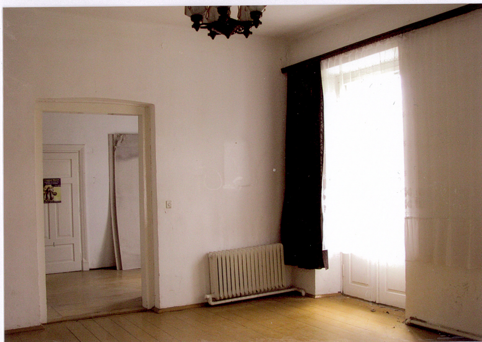
6. Piotrawin, stara plebania, widok wnętrza