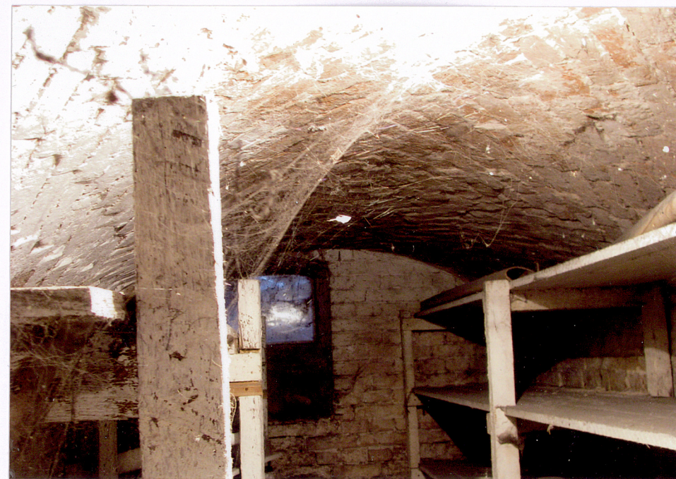
8. Piotrawin, stara plebania, sklepienie w piwnicy