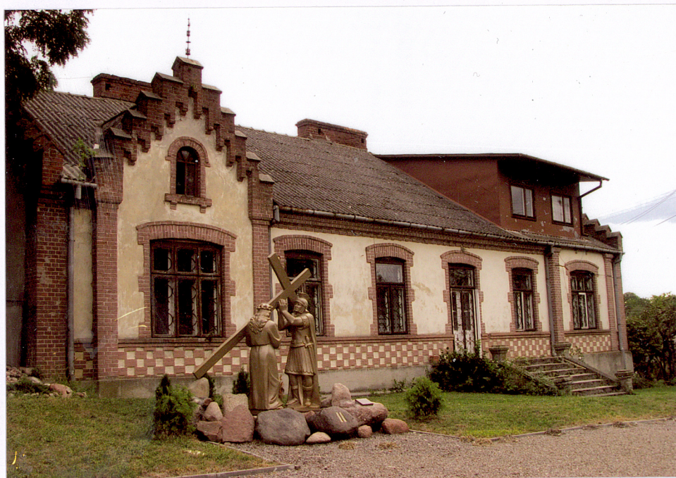
2.Piotrawin, stara plebania, elewacja tylna - zachodnia

Wod.kan.;c.o. elektr.,alarmowa przeciwpożarowa i przeciwwłamaniowa.