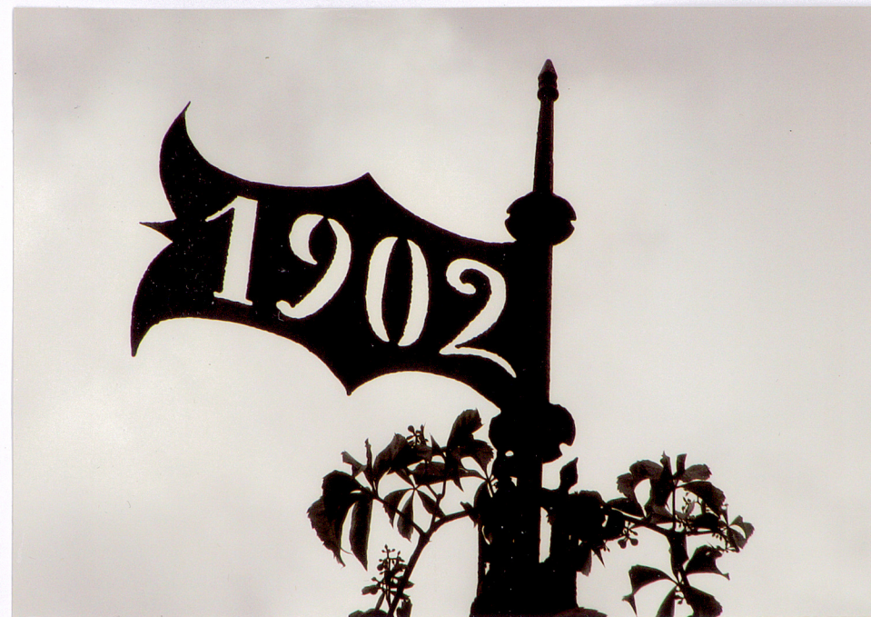
5. Piotrawin, stara plebania, chorągiewka z datą budowy