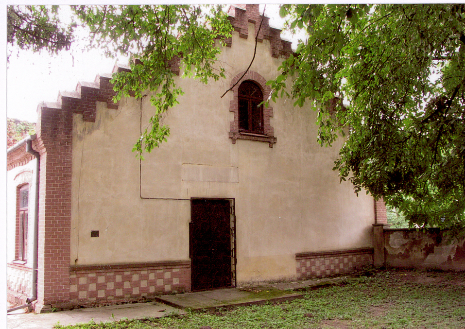
3.Piotrawin, stara plebania, elewacja pñ.