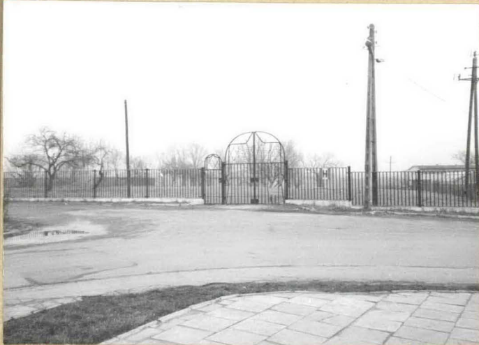
1. Widok cmentarza od południa. Ogrodzenie i brama od ul. Kruczej.

Ad. 8 jego założenie w tym miejscu sięga XV wieku .