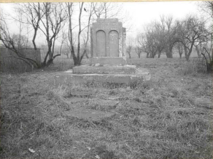
2. Pomnik betonowy (nr 2 na planie)