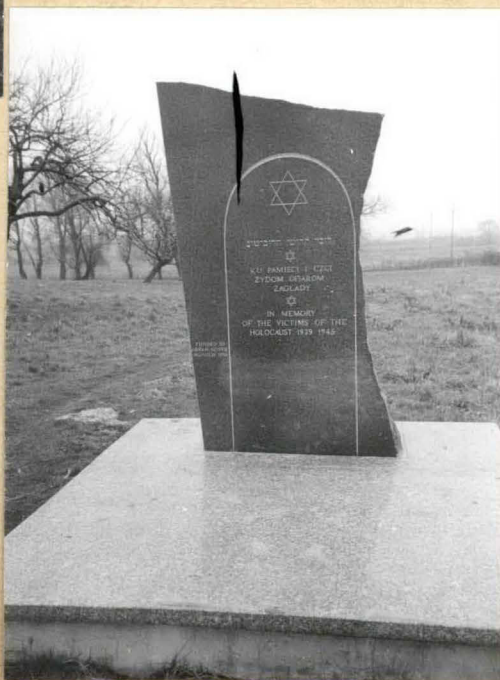
4. Granitowy pomnik (nr 1 na planie).

nr 2. Betonowy długość szerokość określenie "Cześć Hrabie mieszka ogrodzi przed od plan mieszka