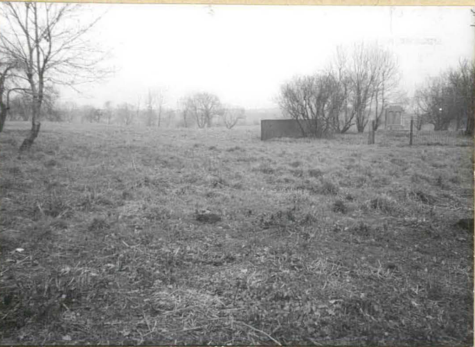
3. Południowa część cmentarza. W głębi widoczny pomnik betonowy.