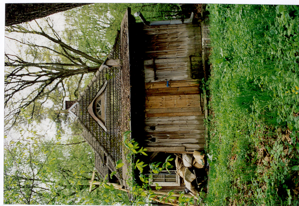
Elewacja pld.-zach. Elewacja pln.-zach.