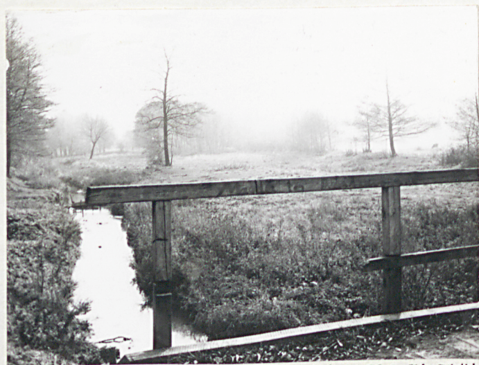
WIDOK Z MOSTU- ŚLUZY W KIER. DAWNEGO ZALEWU