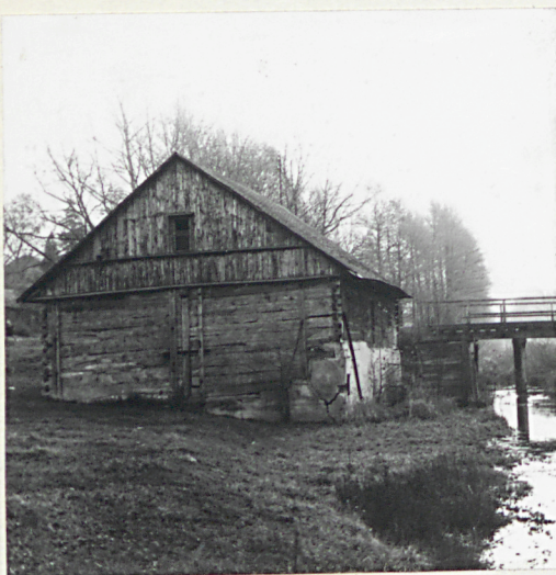
WIDOK OD PŁN.

11. Zdjęcia, rzut, przekrój, sytuacja, orientacja