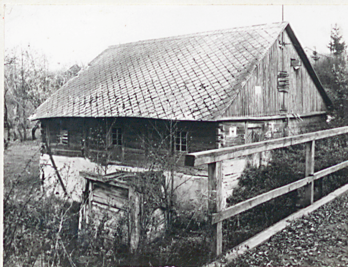
WIDOK Z MOSTU - ŚLUZY