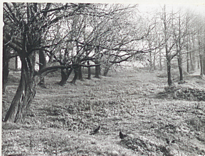
TEREN DAWNEGO ZALEWISKA