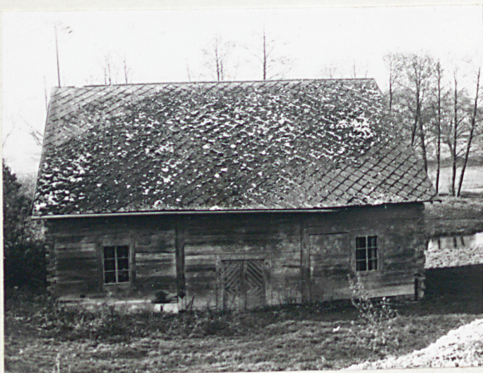
WIDOK OD WSCH.

w skład której wchodzi (uregulowane w ks. wieczystej KW Nr 3658 i Dobra Mętów lit.A): działka obejmująca plac młyński ze śluzą, budynkami i dojazdem, grunt orny, grunt po dawnym zalewie - stanowiący tzw stawisko, teren rzeki, drogi i nieużytki. Z wyżej podanej powierzchni została zajęta i wyłączone na budowę szkoły przestrzeń 1 ha 20 arów, stanowiąca pierwotnie grunt orny.