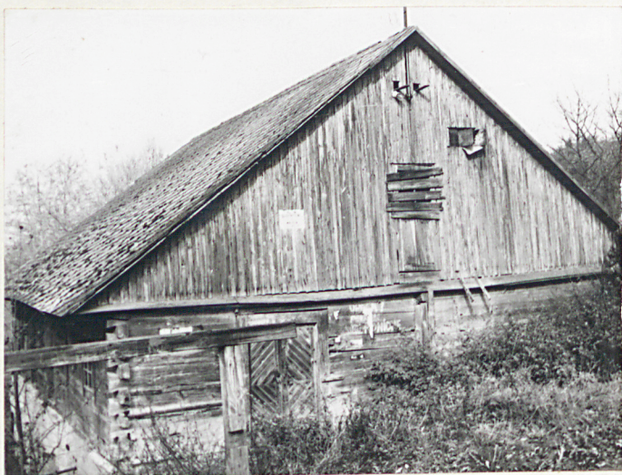
WIDOK OD PŁD.