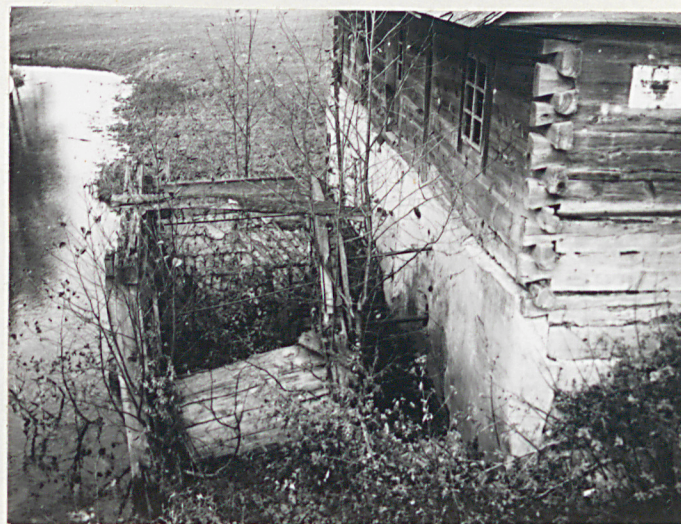
POZOSTAŁOŚCI PIERWOTNEGO NAPĘDU