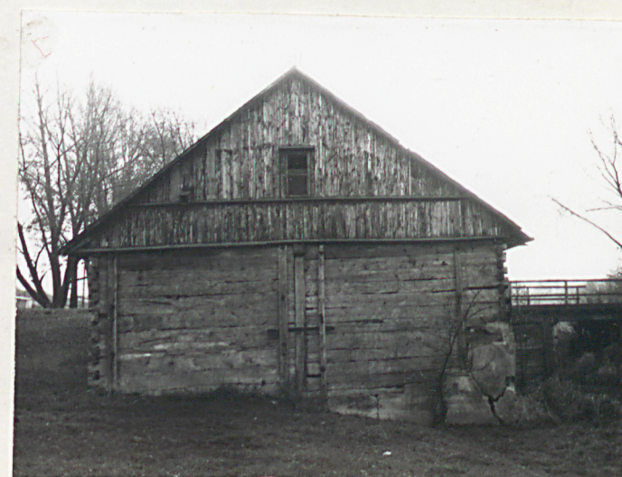
WIDOK OD PEN.