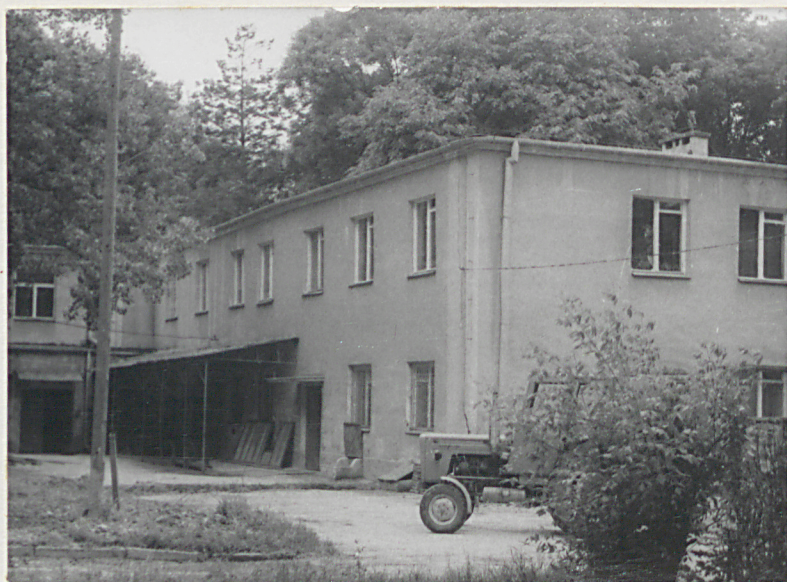
ELEW. WSCH. I PŁN.