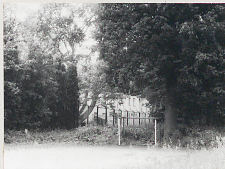
WIDOK OD PŁN. ZACH.