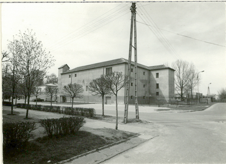
Widok od pn.-wsch.