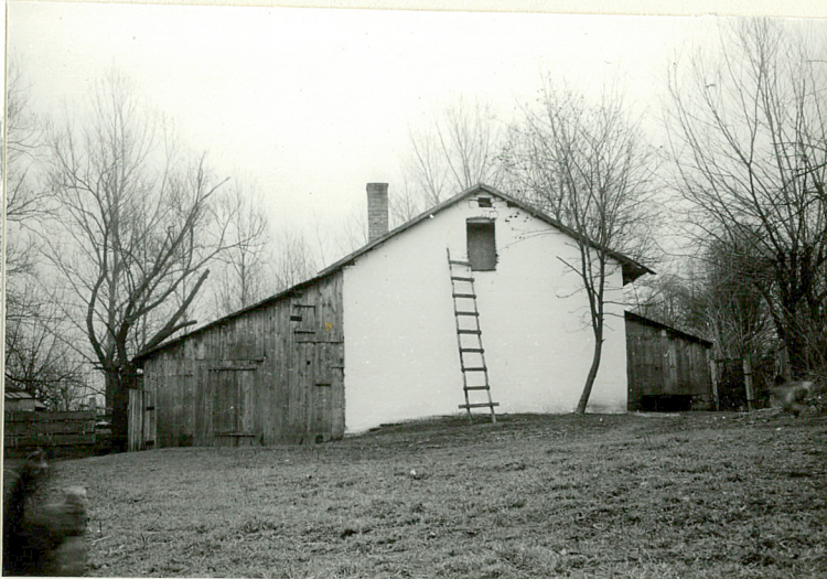
Widok od pn-zach.