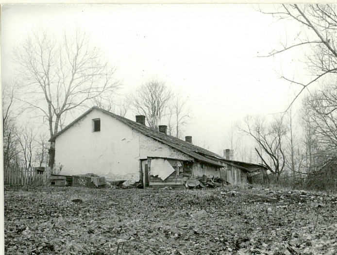
Widok od wsch.

Wkładkę założył: Zbigniew Pastuszek, I 1988r.