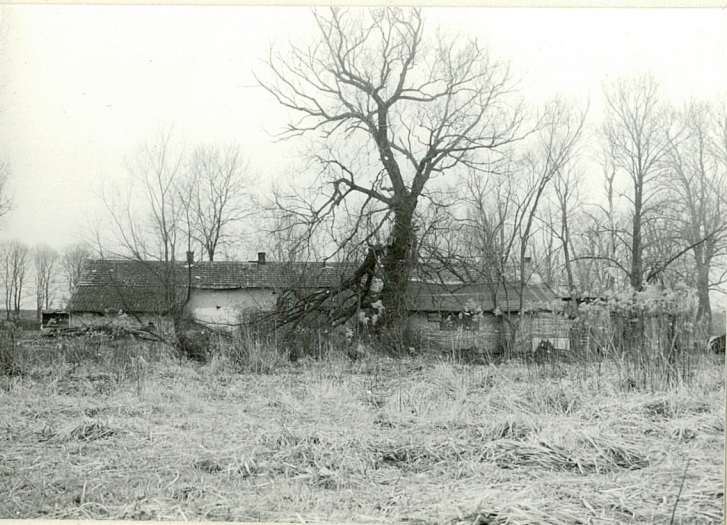
Widok od pn-wsch.