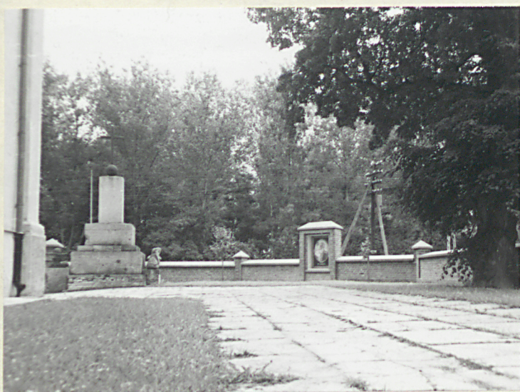
Widok od pn-wsch.