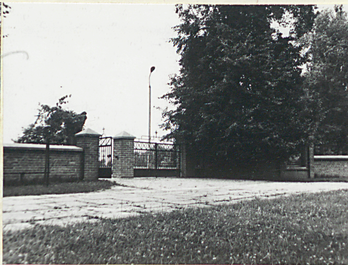
Widok od pd.