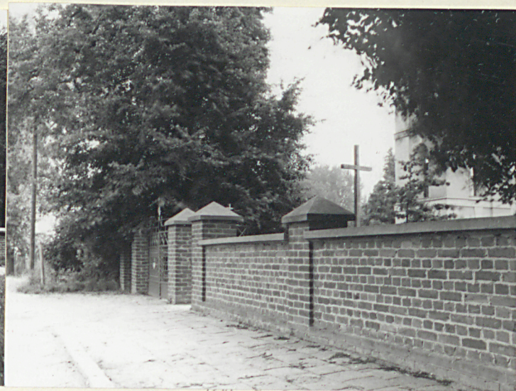
Widok od zach.