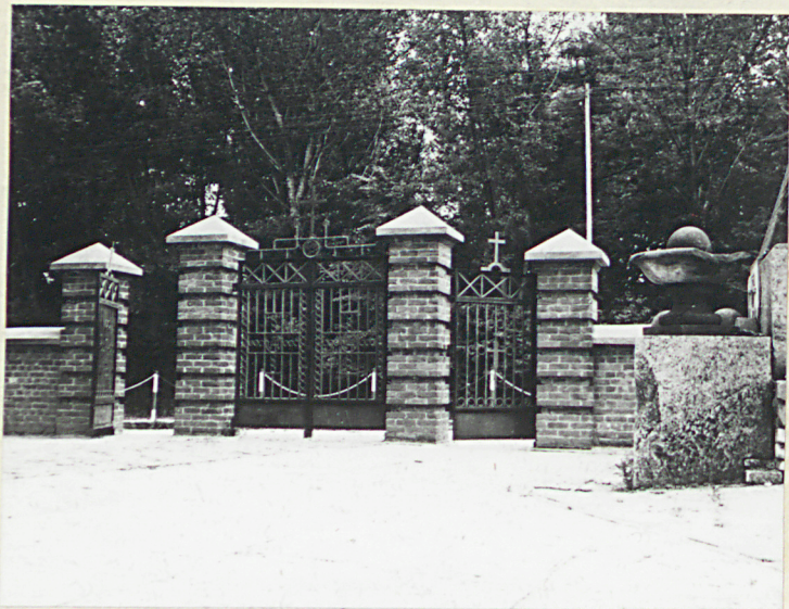
Widok od pn-wsch.