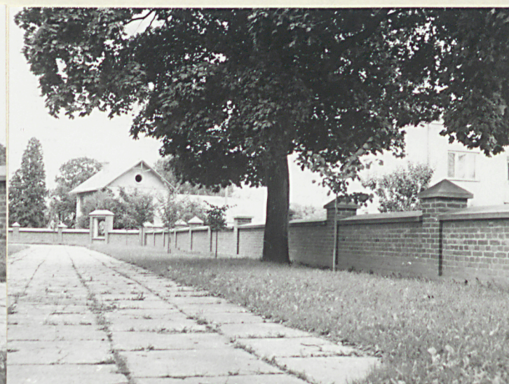
Widok od pd-zach.

Wkładkę założył: Zbigniew Pastuszek, VII 1988r.