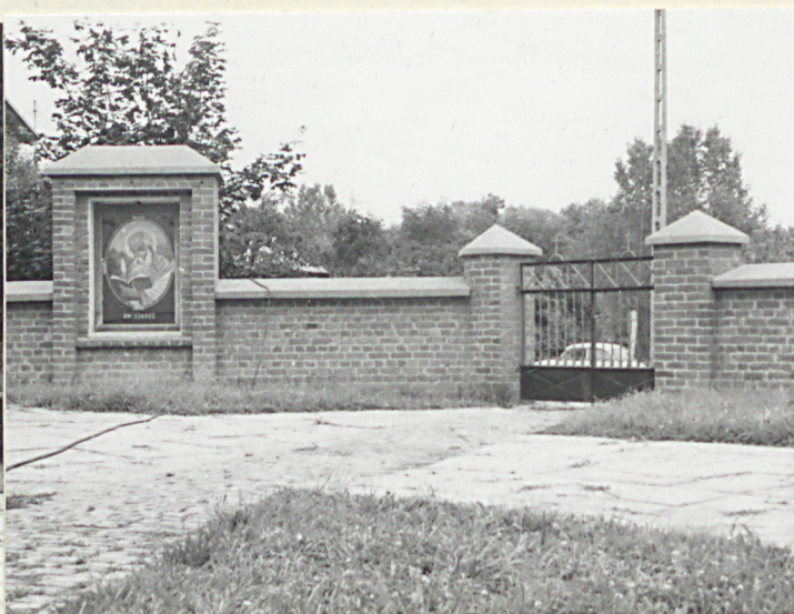
Widok od zach.