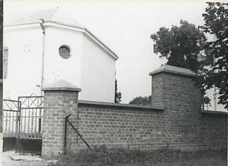
Widok od wsch.