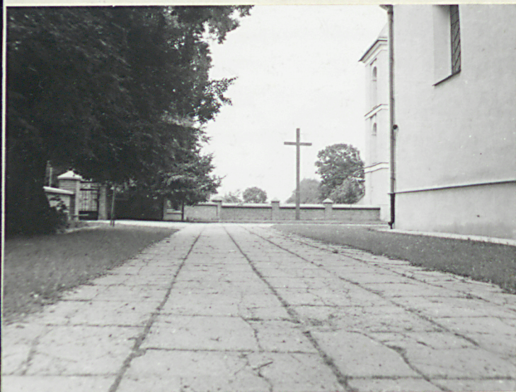
Widok od pd-zach.