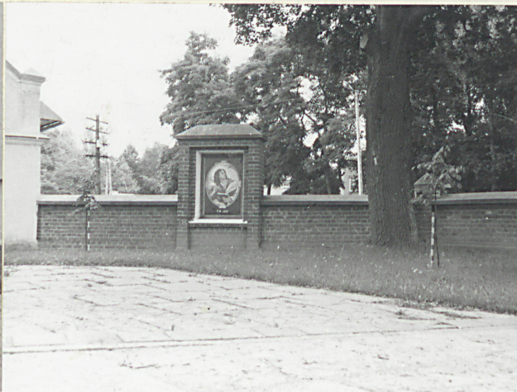
Widok od pn-zach.