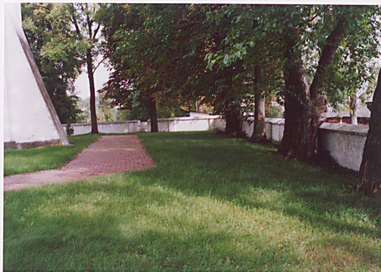
Widok na płn. i zach. część ogrodzenia