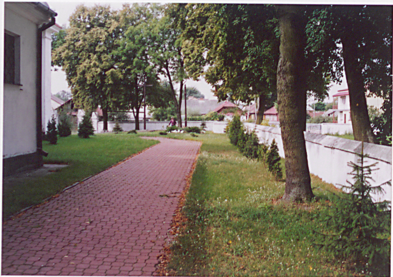
Widok na płd. i wsch. część ogrodzenia