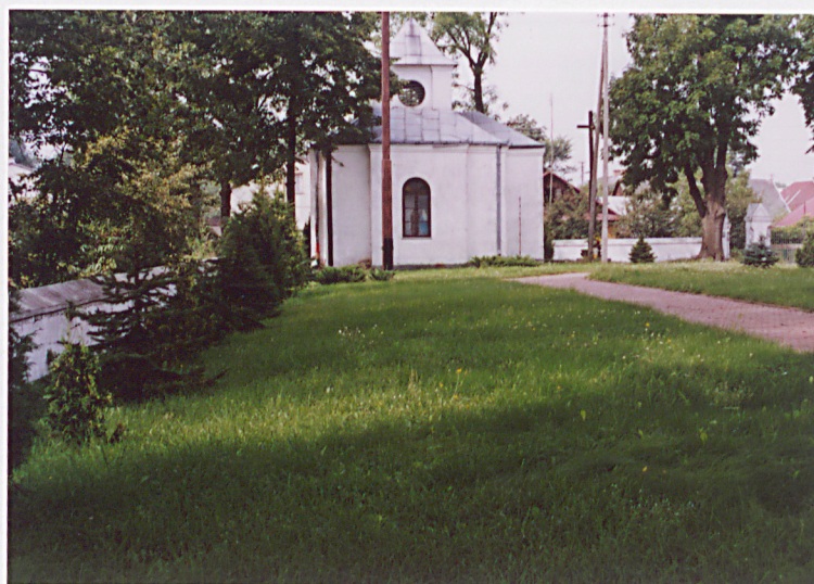
Widok na płd. i zach. część ogrodzenia)

Wkładkę założył: ..... Jacek Studziński 06.2004 ..... (imię, nazwisko, data)