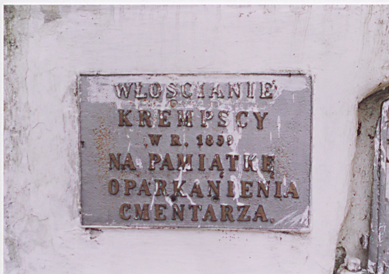
Tablica fundacyjna na filarze bramnym