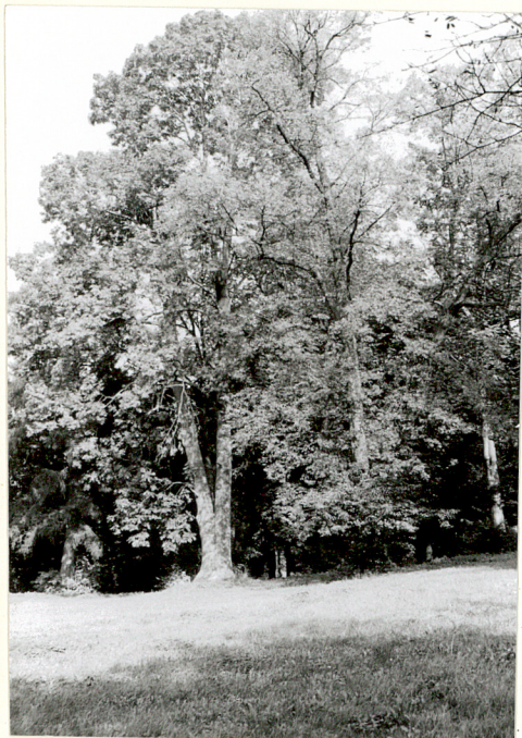
pomnikowe drzewo w parku