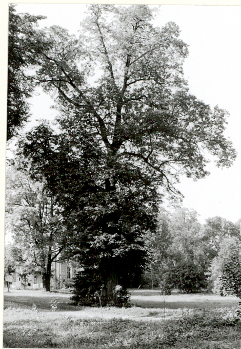
pomnikowe drzewo w parku