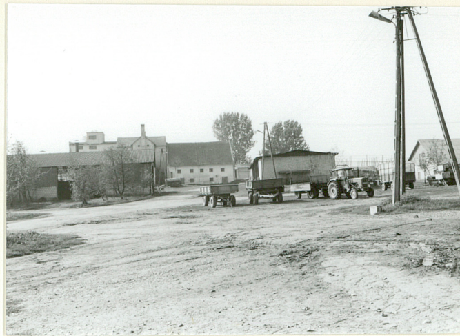
d. część folwarku-widok ogólny