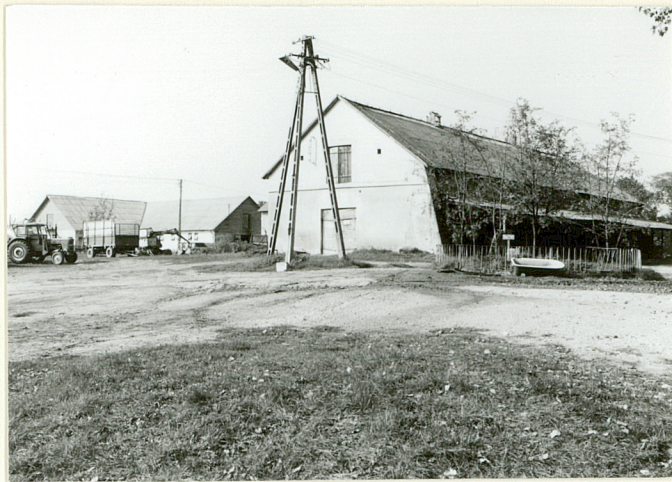
FRAGM. ZABUDOWAŃ GOSPODARCZYCH