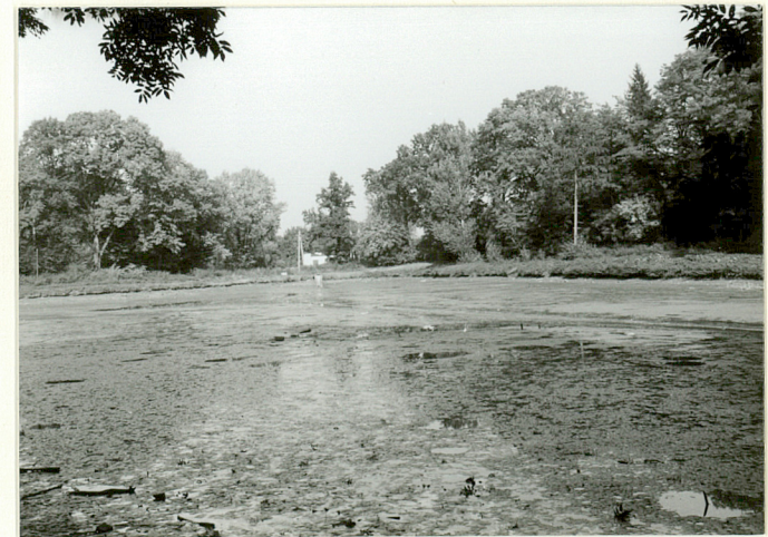
staw w środkowej części założenia