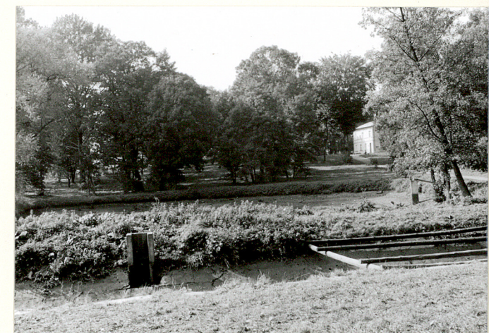
staw w pd. części założenia