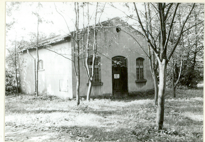
fragm. zabudowań gospodarczych