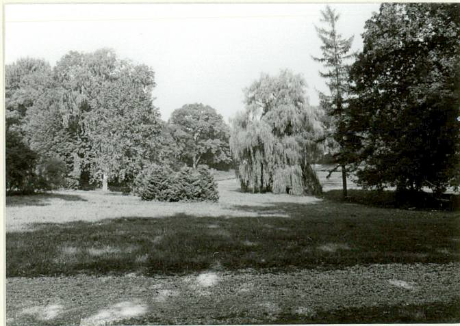
fragm. parku w centralnej części założenia