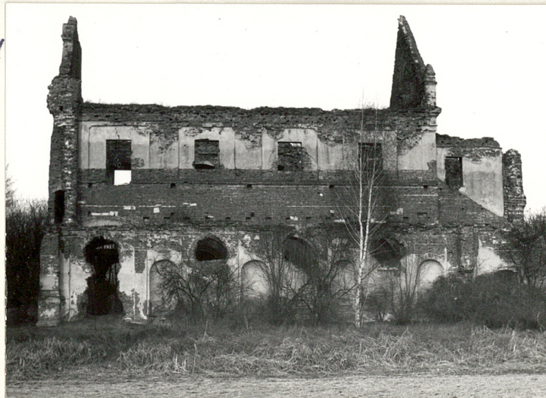
Fot.4 Wejście gł. /zach./