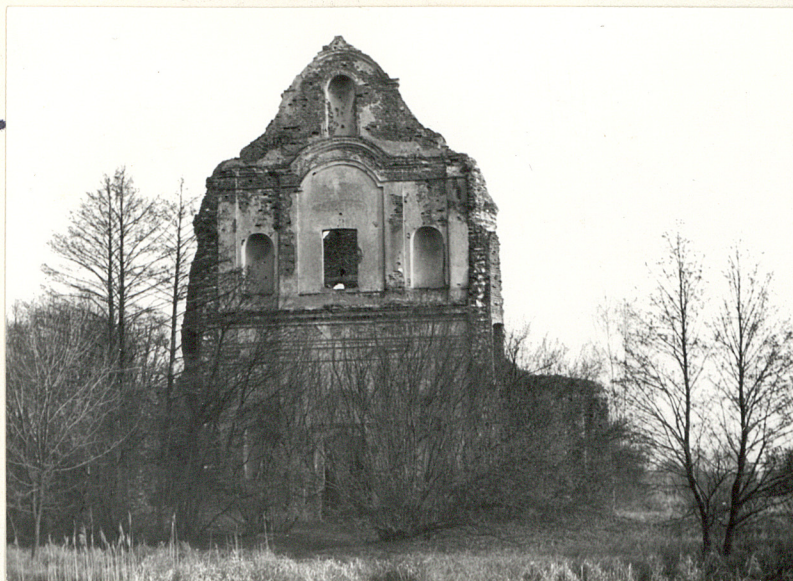
Fot.2 Widok od pd.-wsch.