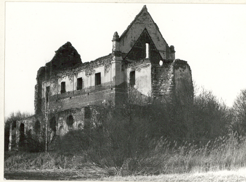
Fot.3 Elewacja pd.