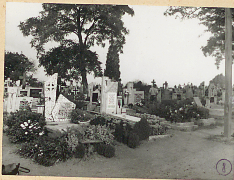
5.. Wk. cmentarza w kierunku północnym.