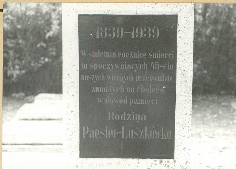
1. Pomnik poświęcony zmarłym na cholerę w 1839r. - wystawiony przez rodzinę Paesler z Luszkówka