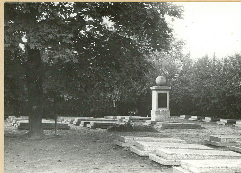
2. Wnętrze cmentarza z pomnikiem