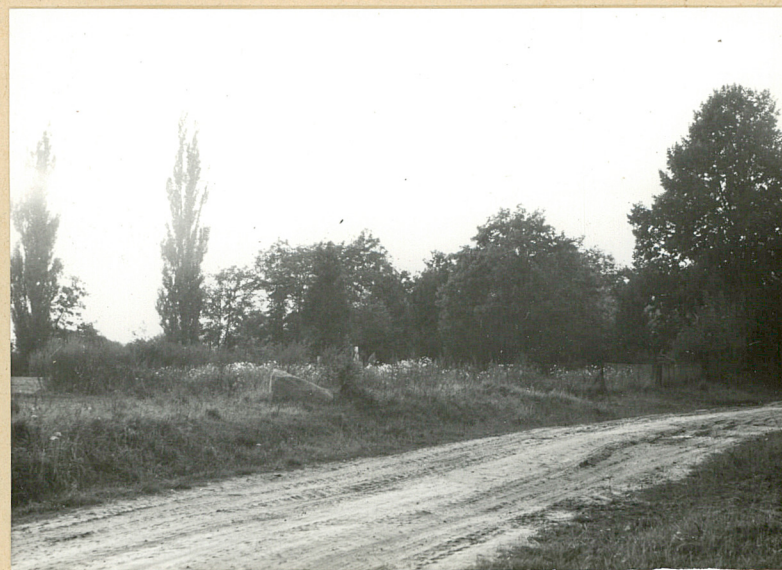
3. Widok na cmentarz od strony drogi gruntowej