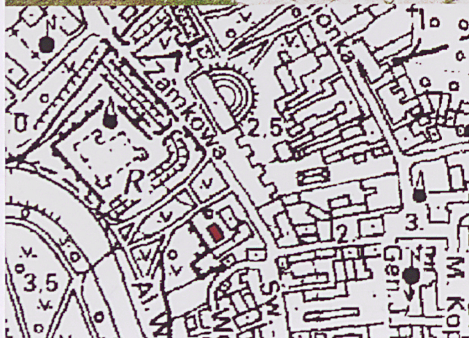
Plan orientacyjny, skala 1:2 000