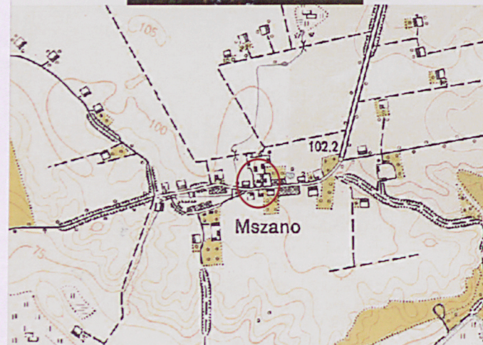
Plan orientacyjny, skala 1:5 000