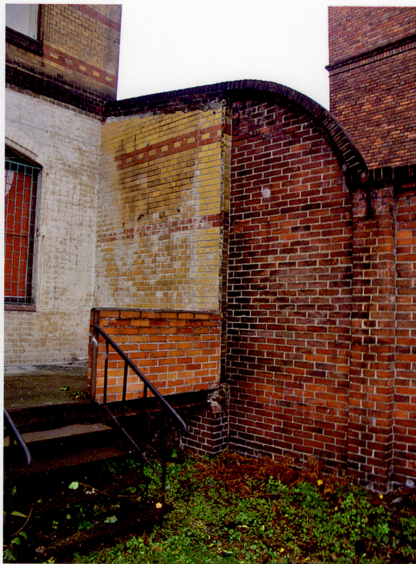
Fot. 19. Hol ze schodami.