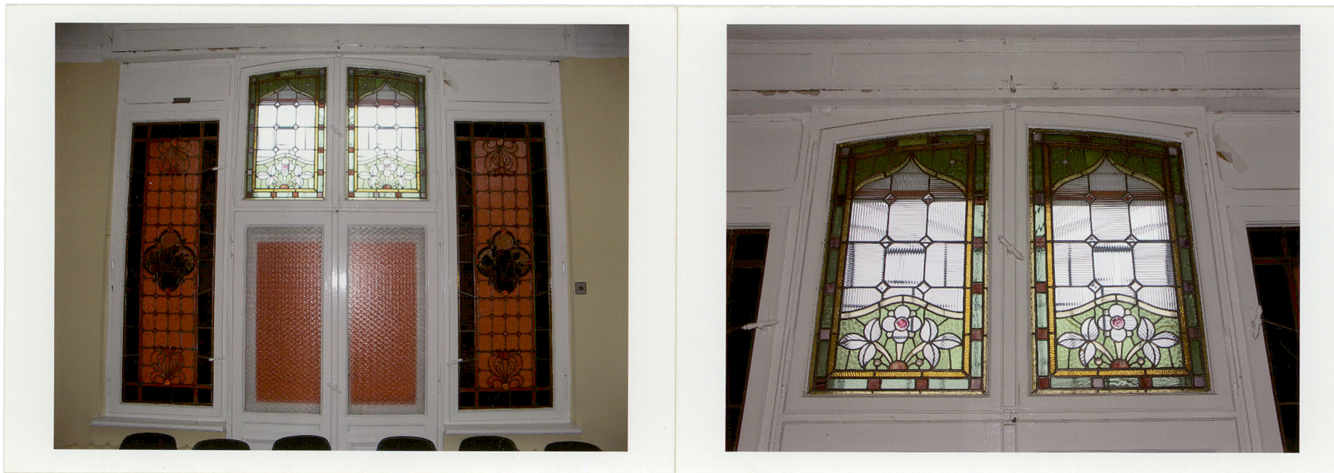
Fot. 32. Witrażowe okno we wschodnim murze wschodniego pomieszczenia tylnego traktu.