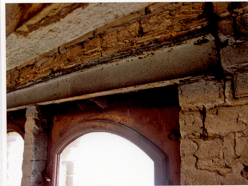
Fot. 44. Fragment więźby dachowej.