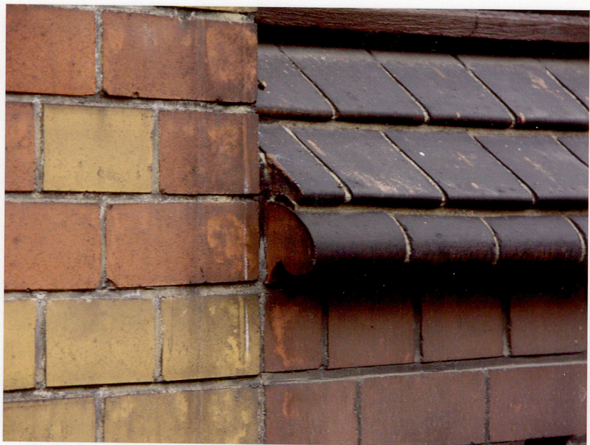
Fot. 17. Parapet z kształtek ceglanych.