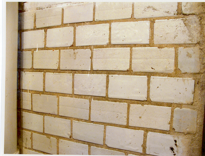
Fot. 43. Okładzina ściany z emaliowanej cegły w południowo – wschodnim pomieszczeniu sutereny.