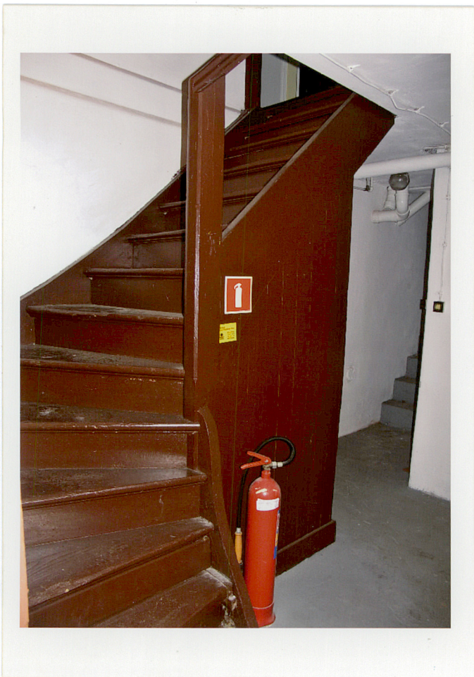
Fot. 47. Schody w piwnicy.