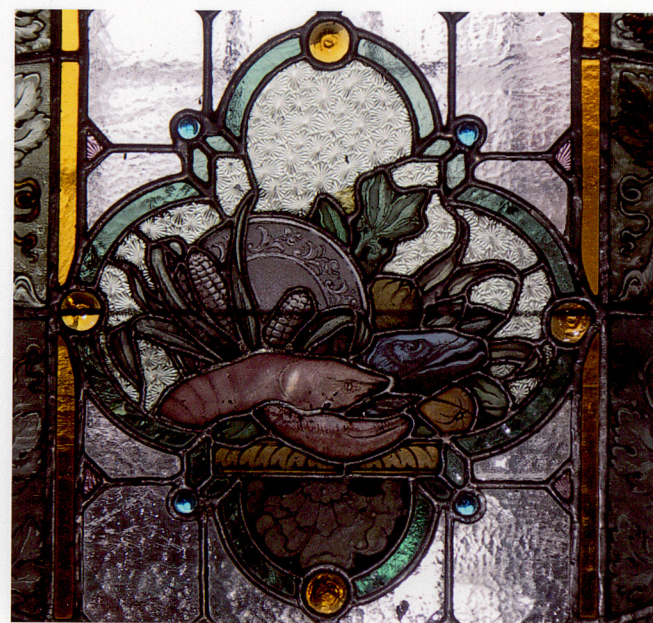
Fot. 34. Prawe skrzydło okna we wschodnim murze wschodniego pomieszczenia tylnego traktu.