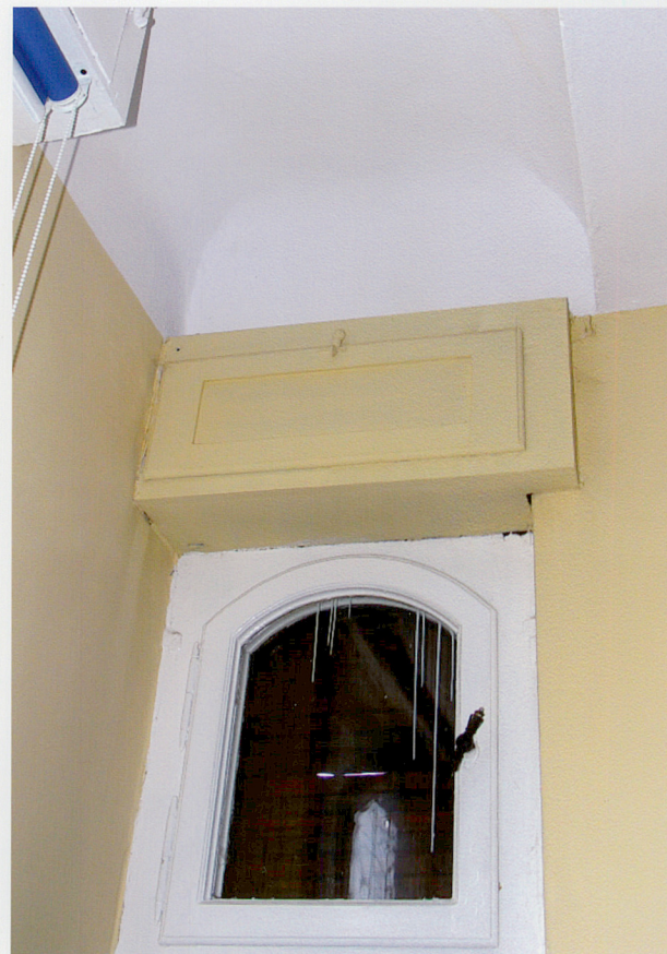
Fot. 29. Faseta i stiukowa dekoracja sufitu zachodniego pomieszczenia północnego traktu.