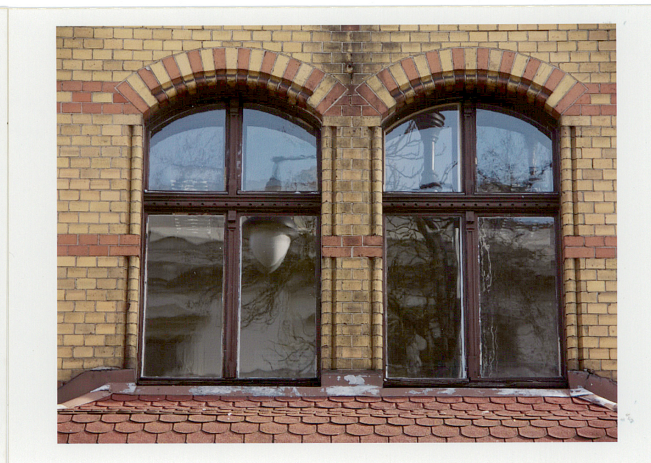
Fot. 8. Okno parteru zachodniej elewacji.