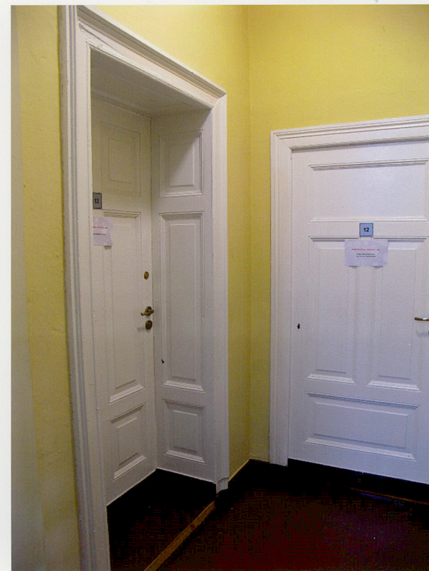
Fot. 38. Rozsuwane drzwi między pomieszczeniami północnego traktu.