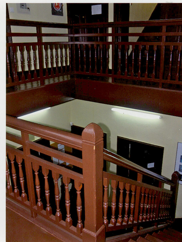
Fot. 20. Widok z podestu na bieg schodów i galerię piętra.