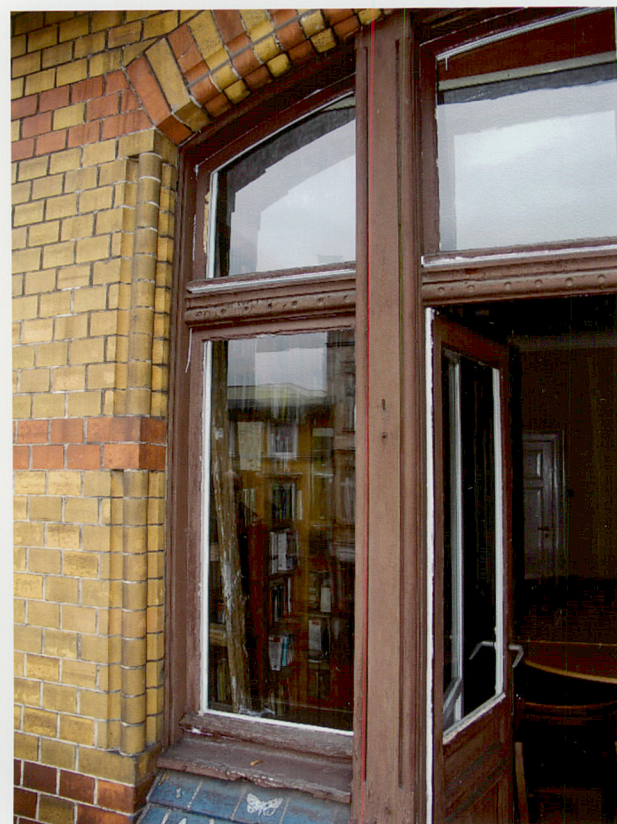
Fot. 10. Okno parteru elewacji południowej.