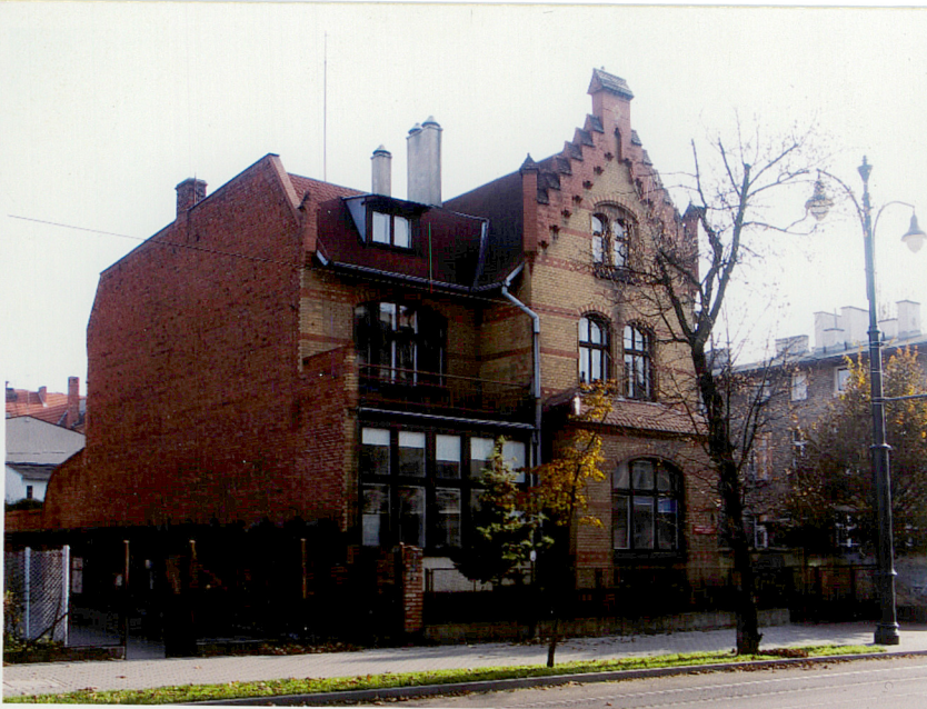
Fot. 2. Widok ogólny od północnego – zachodu.