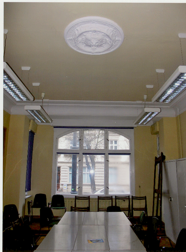
Fot. 28. Widok ogólny zachodniego pomieszczenia północnego traktu.