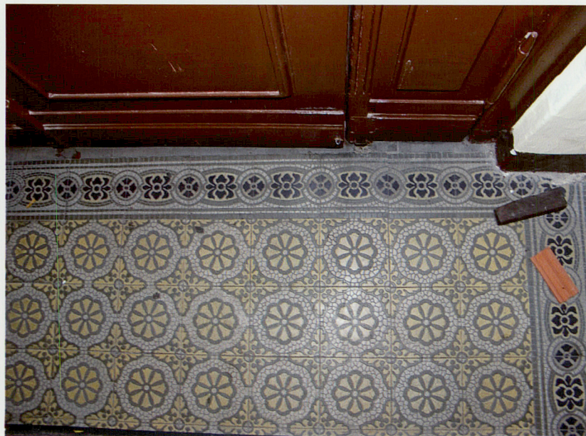
Fot. 26. Posadzka w przedsionku holu.