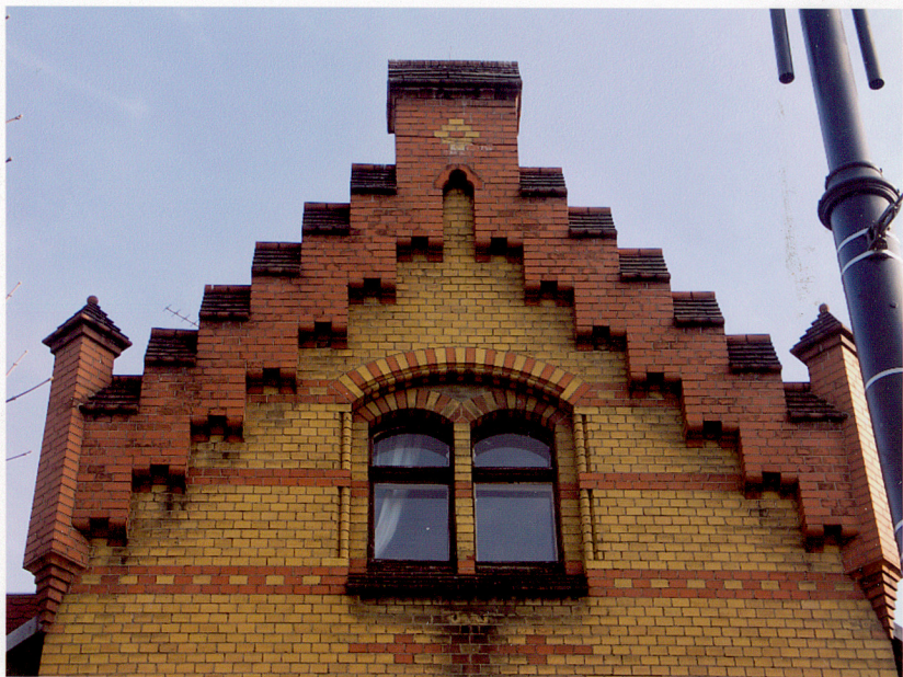
Fot. 5. Szczyt w elewacji zachodniej. Fot. 6. Tylna część zachodniego szczytu. Fot. 7. Wejście w elewacji południowej.