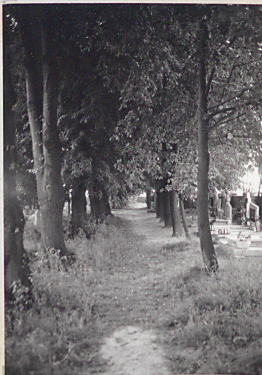
11. Widok na fragment bocznej alei cmentarza z doskonale zachowanym drzewostanem lipy drobnolistnej.