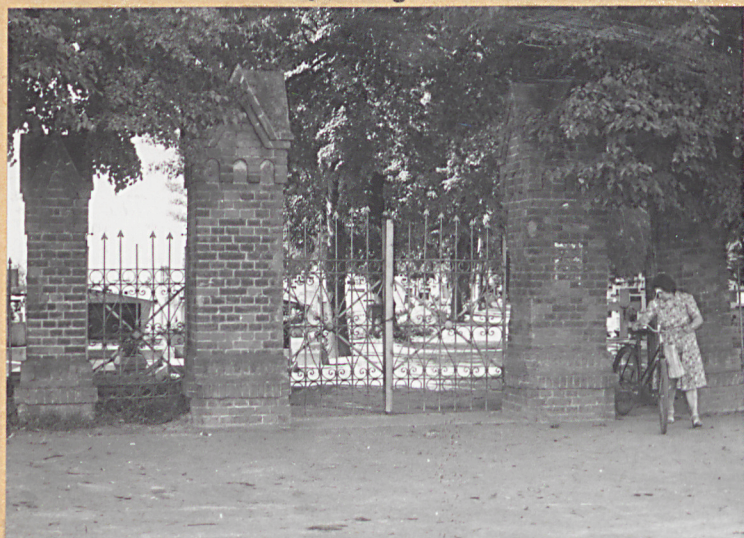
1. Widok bramy głównej cmentarza z przełomu XIX i XX stulecia.