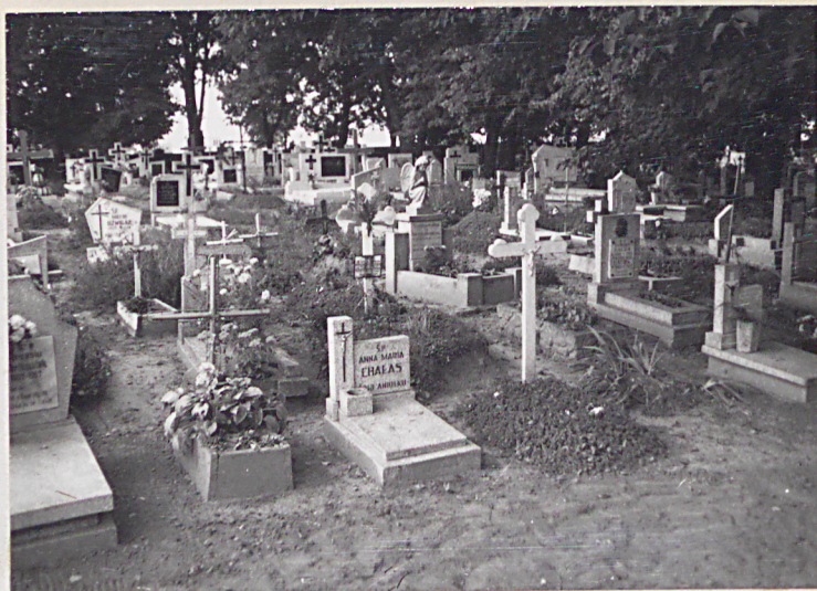
8. Widok na fragment kwatery dziecięcej cmentarza.