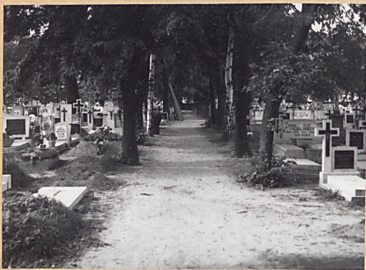
3. Widok na główną aleję cmentarza.