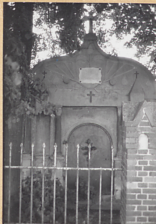
2. Grobowiec kaplicowy Familji Adamskich z końca XIX wieku z ciekawym zdobieniem fasady.