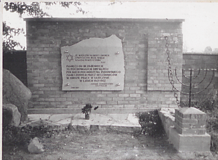
10. Pomnik ku czci 100 bezimiennych obywateli polskich pochodzenia żydowskiego zamordowanych przez hitlerowców w latach 1940-42 w obozie pracy w Murczynię.