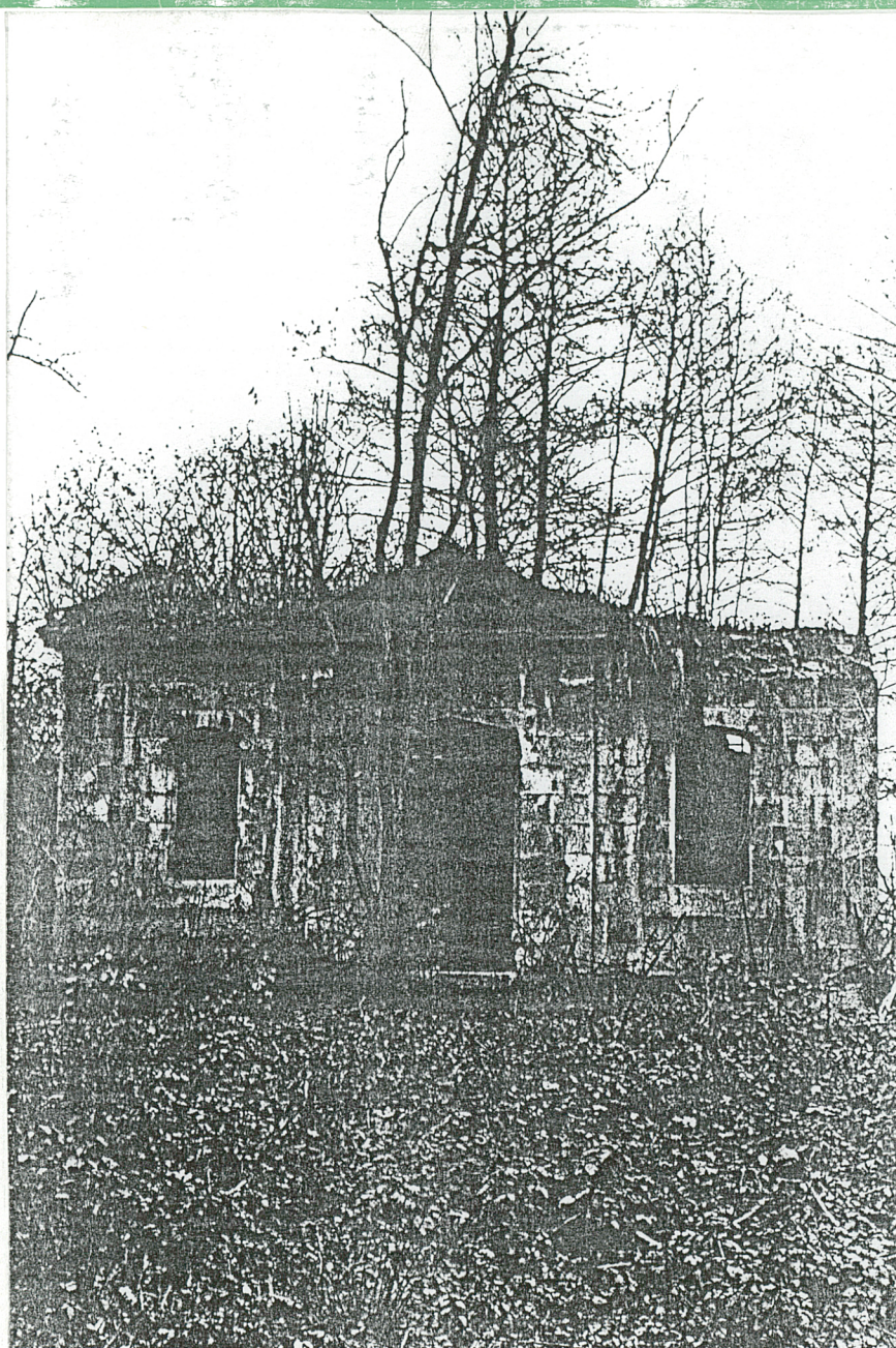
8. Ruiny grobowca Jesień 1976 r.