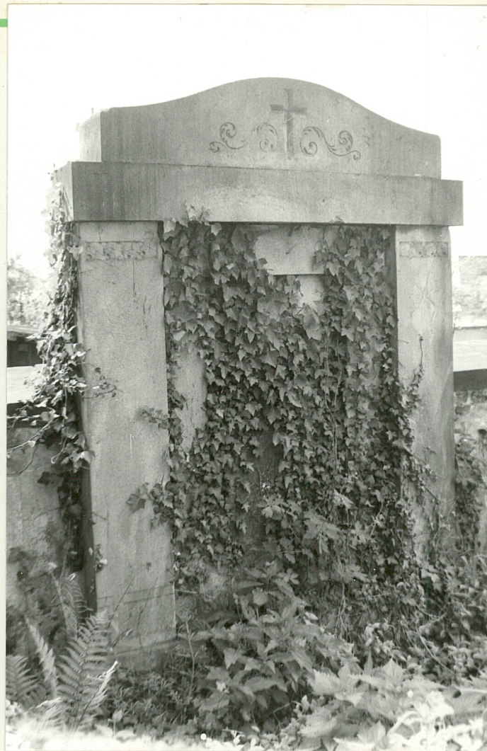
8. Nagrobek architektoniczny piaskowcowy rodziny Gorlach