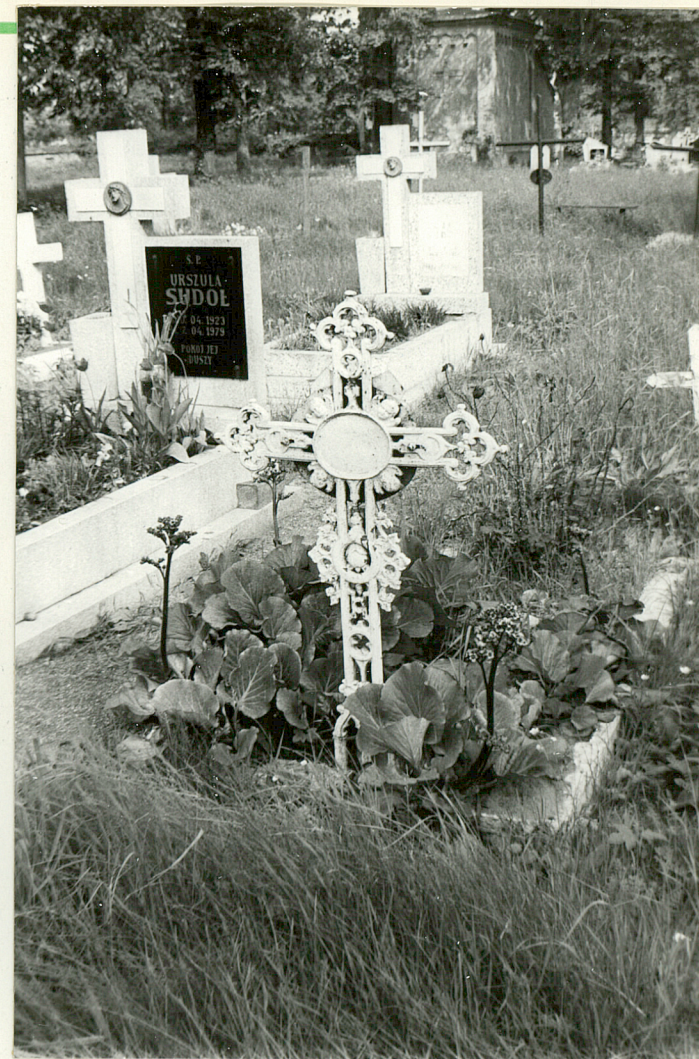
9. Krzyż żeliwny wtórnie użyty