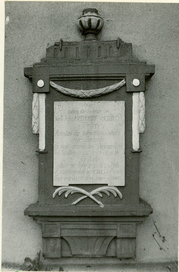
7. Epitaffium Bonianin Gottlieb Förster zm. 1795