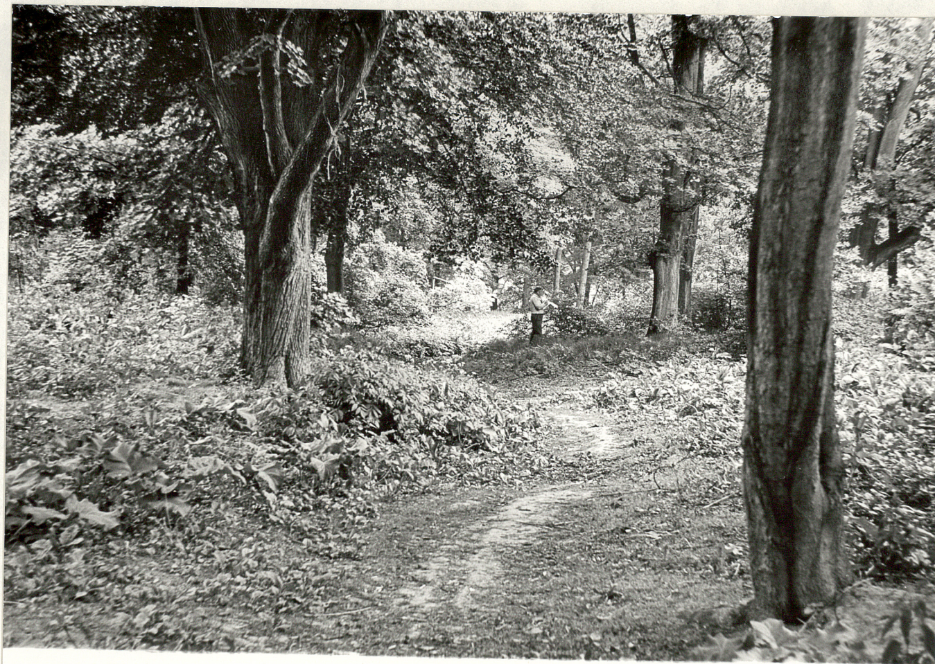
5. Fragment parku.