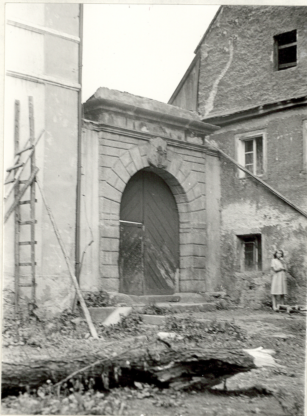
2. Brama oddzielająca folwark od parku.