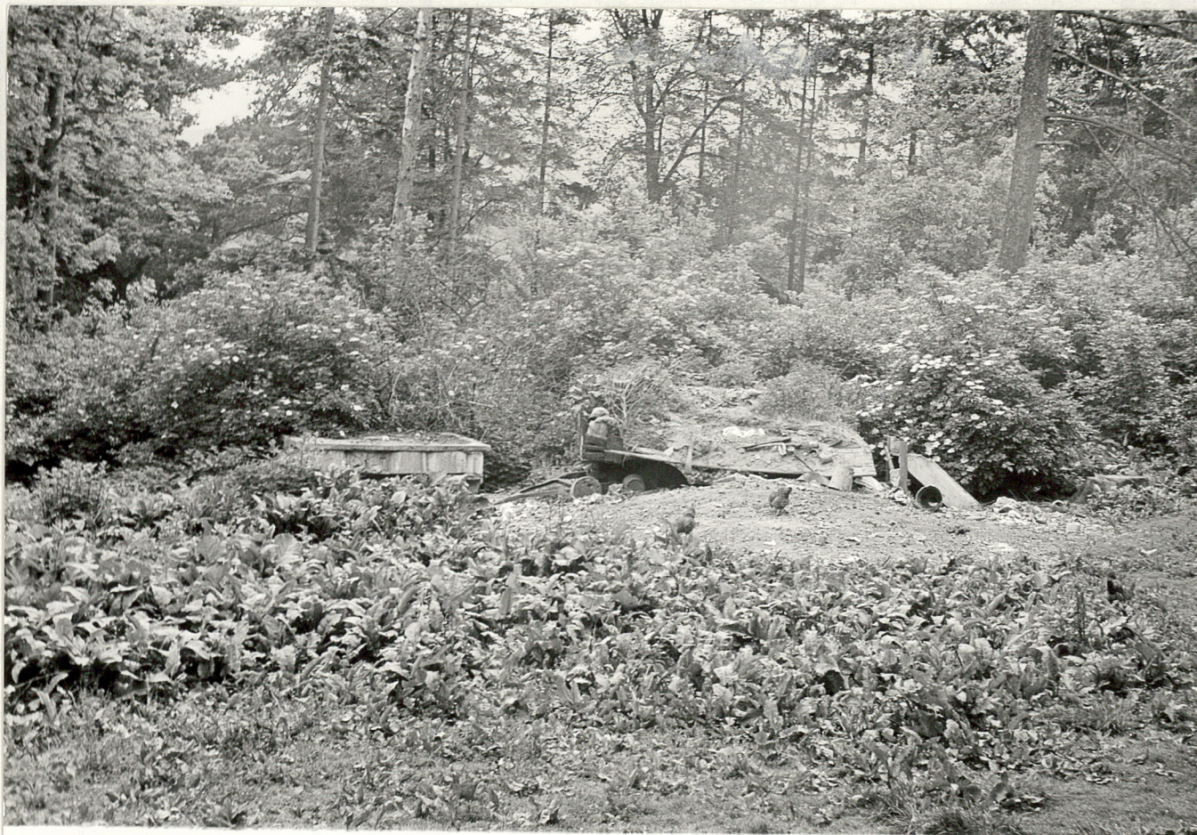
6. Południowy fragment parku.