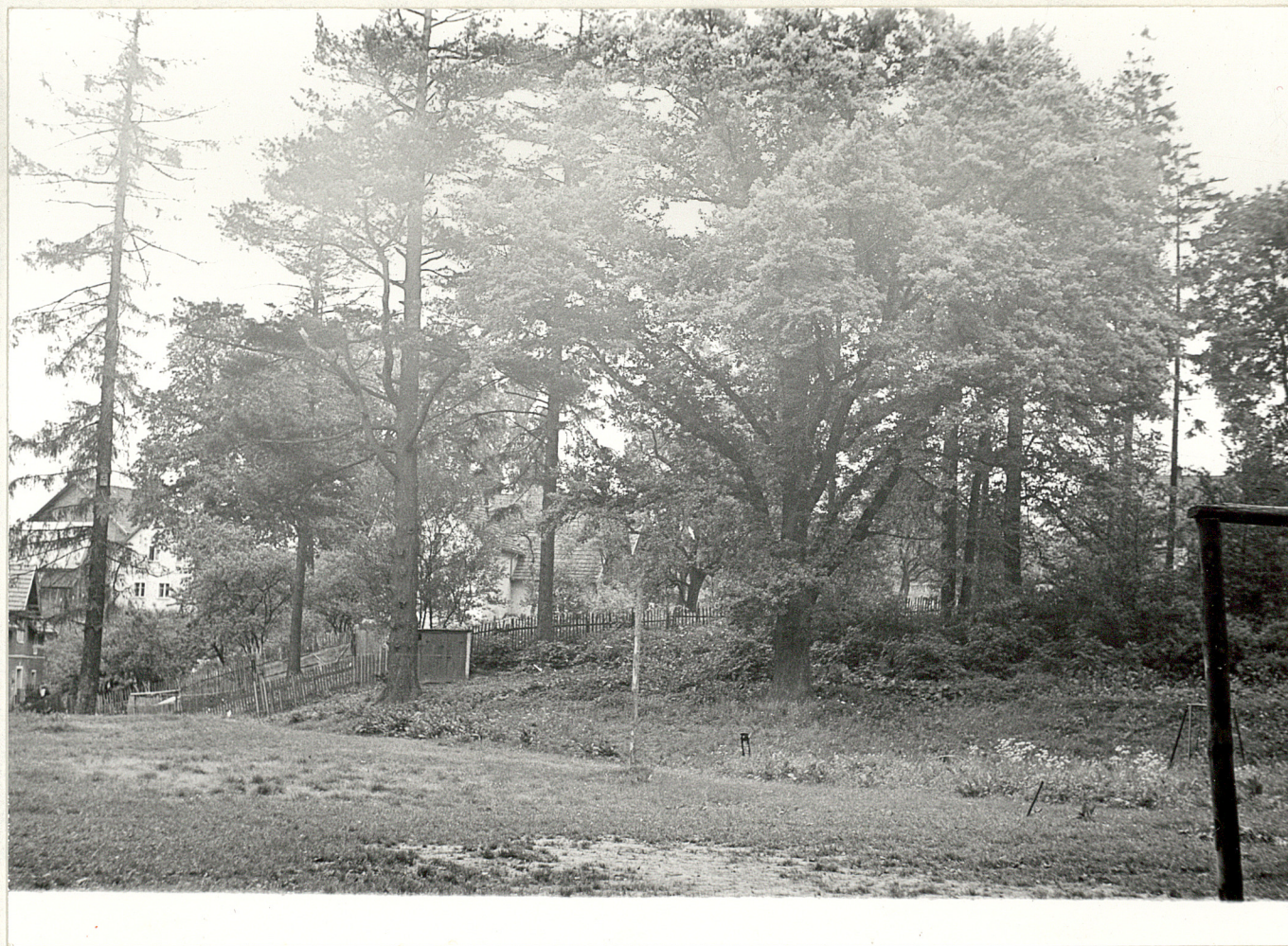
3. Zachodnia część parku.