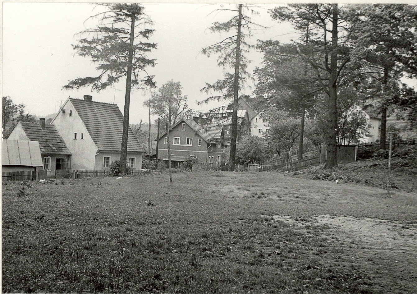
4. Fragment zabudowy wsi, przyległej do parku.