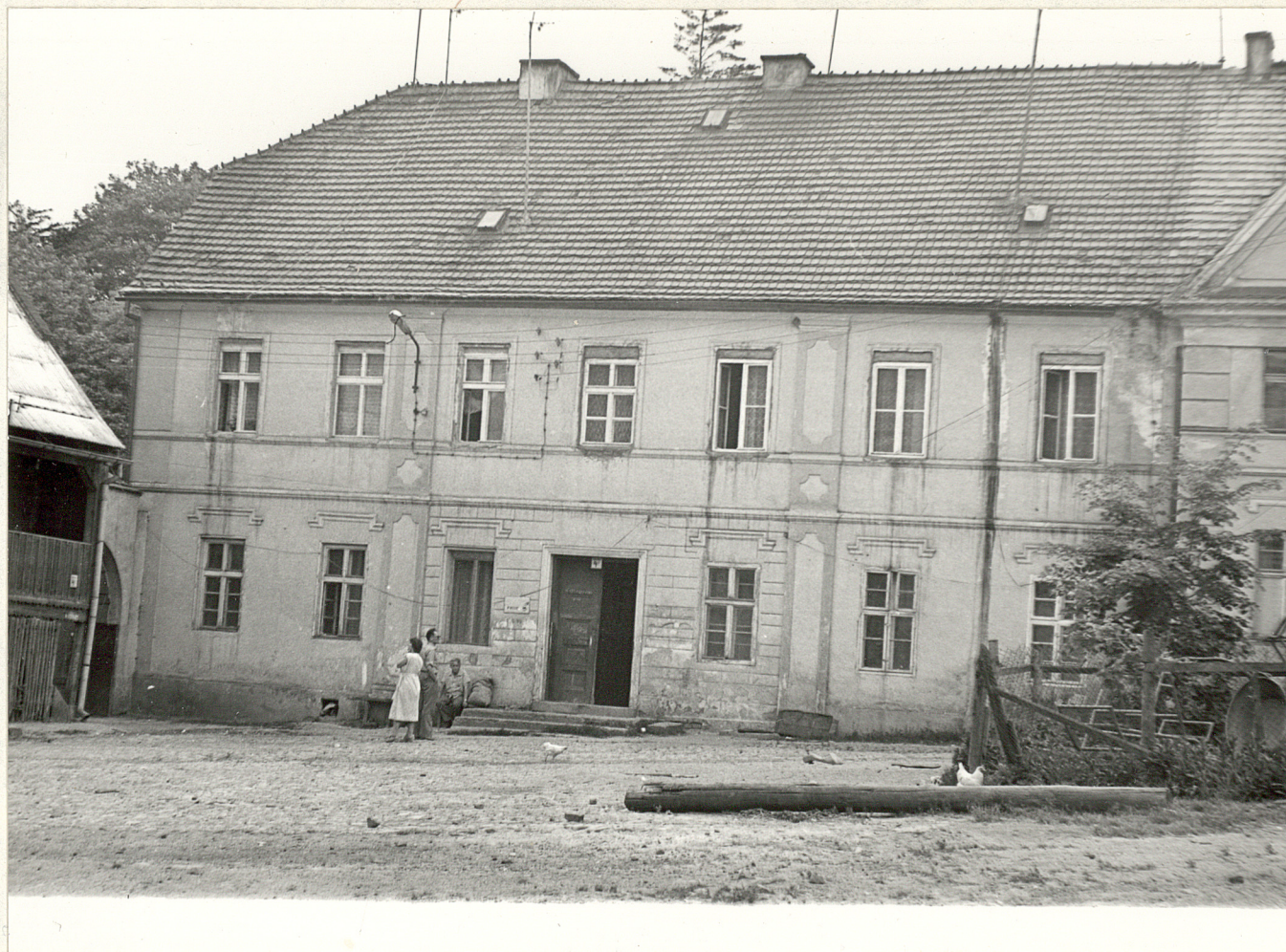
1. Fragment zabudowy folwarcznej.