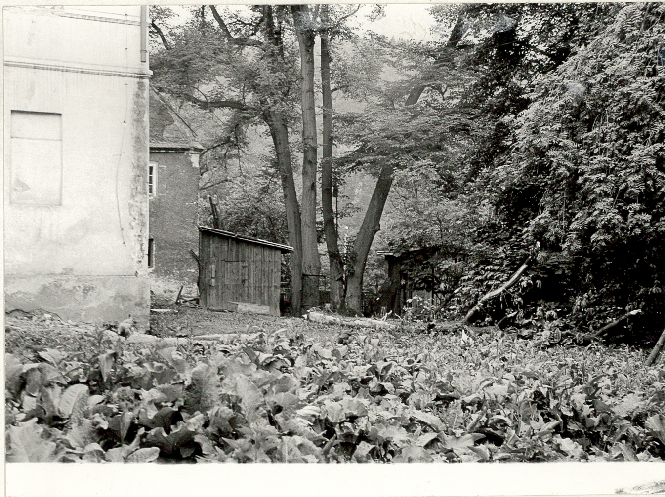
7. Fragment parku obok folwarku.