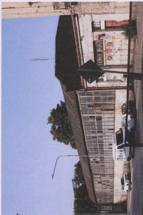
1. Hala warsztatowa, elewacja zachodnia, fot. 05.2018