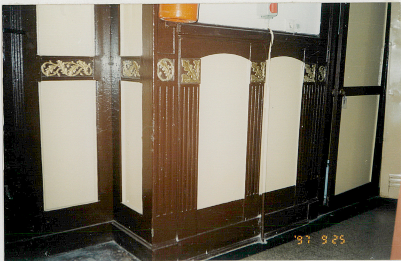
5. Boazeria w holu