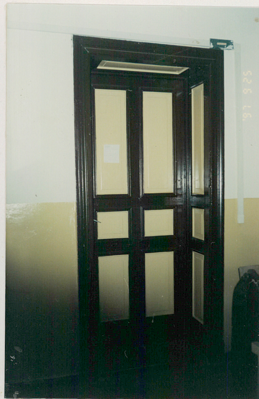
2. Drzwi na I piętrze