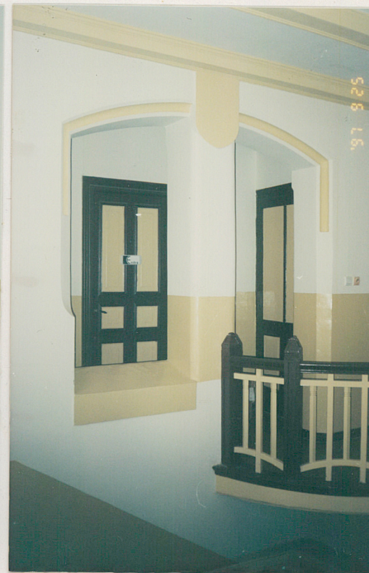
3. Wnęka w holu na I piętrze