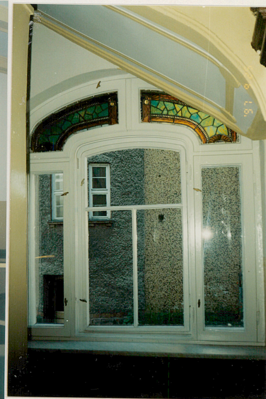
4. Okno z witrażem w holu parteru

Wkładkę założył: Dorota Nowak-Marcinkiewicz