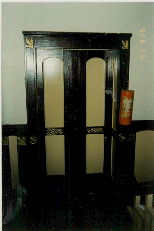
1. Drzwi w holu parteru