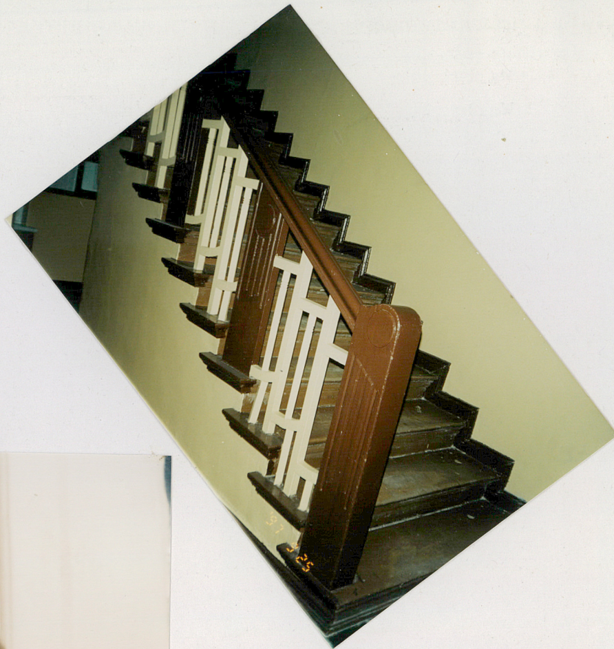
6. Schody wewnętrzne główne