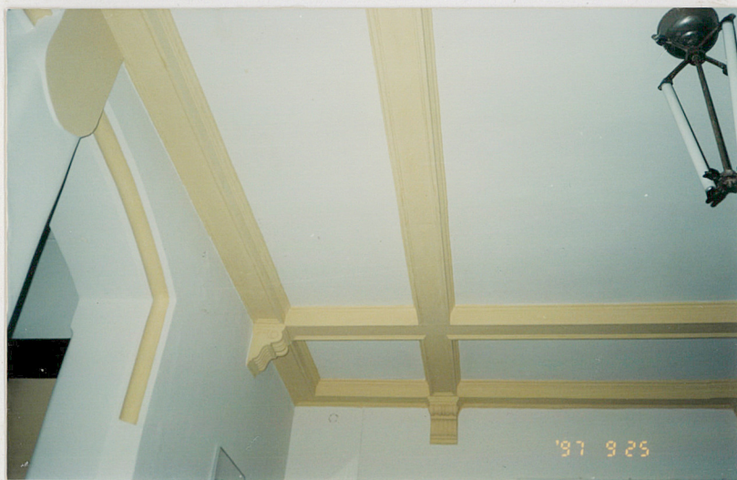
7. Sufit w holu-fragment