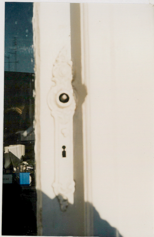
8. Okucie drzwi balkonowych na I piętrze