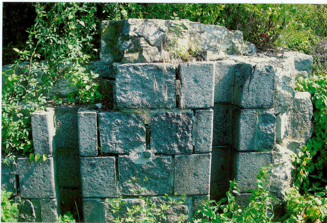
Widok od południa na północny przyczółek jazu.