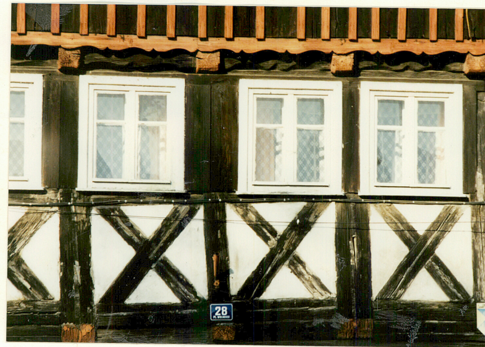
Fragment elewacji frontowej