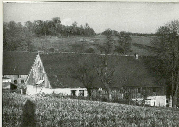
Widok budynku od tyłu