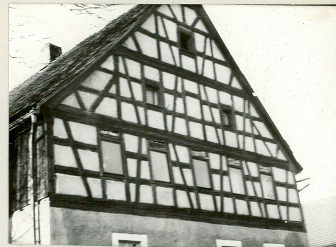
Ściana szczytowa / piętro i dach /