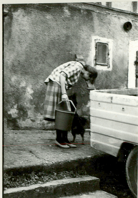
Fragment ściany frontowej / oraz schody /