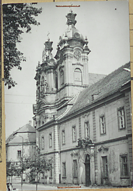
36. Wypełnił dnia