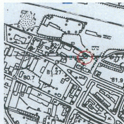
skala 1:10 000