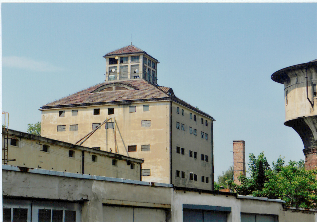
widok od strony północno-wschodniej