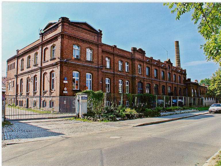
Widok od strony płn.- zach.