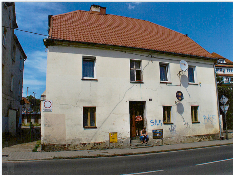
Widok od strony pld.