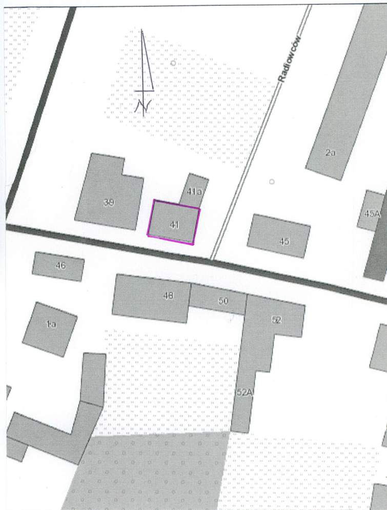
Plan sytuacyjny, skala 1: 1000